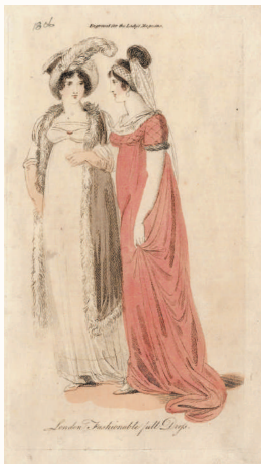
Раскрашенная вручную модная иллюстрация из февральского журнала Lady's Magazine за 1806-й год.

В основном схемы для вышивания были трех видов. Некоторые из них служили для учебных целей, — например, в 1770-х годах в журнале были