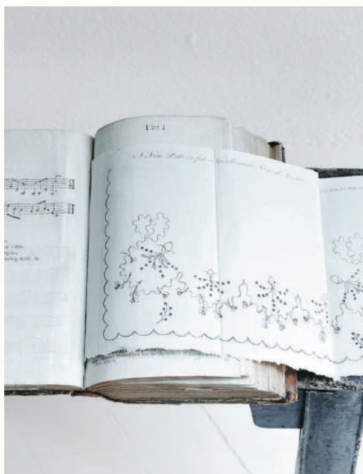
Схема вышивки для мужского галстука из приложения к журналу Lady's Magazine 1796 года.

Поместить выкройки в периодическое издание было весьма дальновидным решением. В течение нескольких лет дублинский журнал Hibernian Magazine (1771–1811 гг.) выпускал выкройки, похожие, а в некоторых случаях идентичные выкройкам Lady's Magazine . Большинство более поздних прямых конкурентов журнала, включая New Lady's Magazine (1786–1795 гг.), изысканное La Belle Assemblée (основанное в 1806 году) и великолепное Repository of Arts Рудольфа Акерманна (1809–1829 гг.), последовали его примеру. Однако ни одно из этих периодических изданий даже