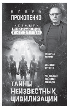
ТАЙНЫ НЕИЗВЕСТНЫХ ЦИВИЛИЗАЦИЙ