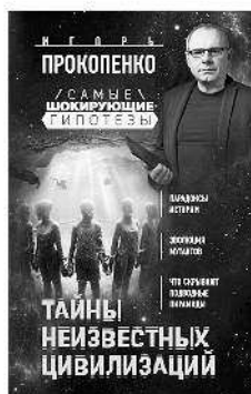
ТАЙНЫ НЕИЗВЕСТНЫХ ЦИВИЛИЗАЦИЙ