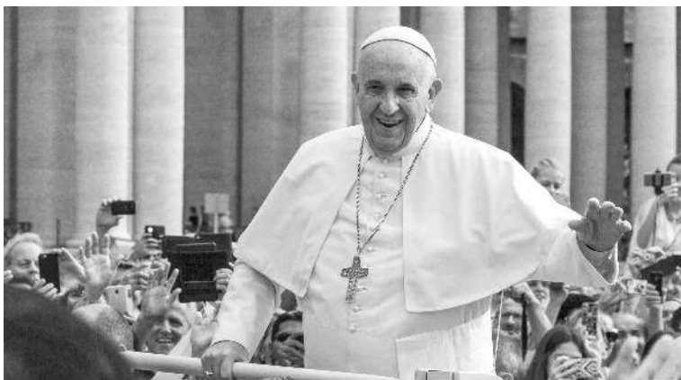
Папа Франциск, 266-й Папа Римский.

считает, что из-за денег мир сегодня катится в бездну. По его мнению, поощрение людей делать деньги из денег напоминает некую игру, цель которой никто не знает, поскольку она затерялась среди потока денег. О том, что с современным обществом что-то не так, сегодня говорят не только известные режиссеры и рок-музыканты. Недавно даже папа римский, главный идеолог Европы и европейского образа жизни, выступил с сенсационным заявлением. Он сказал буквально следующее: «Мировой порядок, в котором мы живем, — это культ власти и денег!» Быть может, впервые за всю историю европейской цивилизации глава Римской католической церкви открыто выступил против существующего строя, назвав современный капитализм новой формой мировой тирании, которая «рыночные интересы возвела в ранг божества, поставила их выше духовного развития всего человечества».