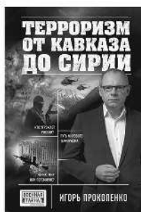
ТЕРРОРИЗМ ОТ КАВКАЗА ДО СИРИИ