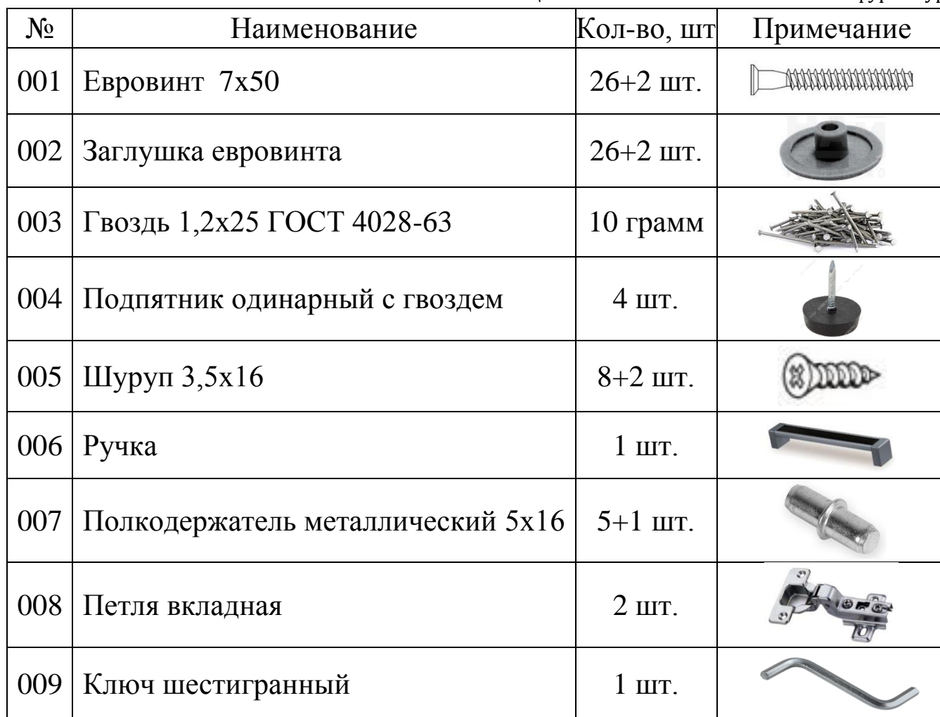
Таблица №2: Комплектность метизов и фурнитуры