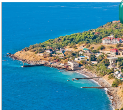
■ Побережье Ялты

Крым — это калейдоскоп из богатой истории, уникальных природных сокровищ, блистательных дворцов, выдающихся памятников, ласковых морей, местной кухни, знаковых личностей. Крым — это яркий пазл из национальностей и культур. По отдельности эти многочисленные грани не существуют, как не может крыша держать дом с одной стеной. В Крыму нельзя только лежать на пляже элитного отеля или только ходить в поход в горы. Нужно обязательно пробовать все. Побродить по развалинам древнегреческого города, посетить царский дворец, спуститься в пещеру, забраться на вершину, искупаться под водопадом, схо-