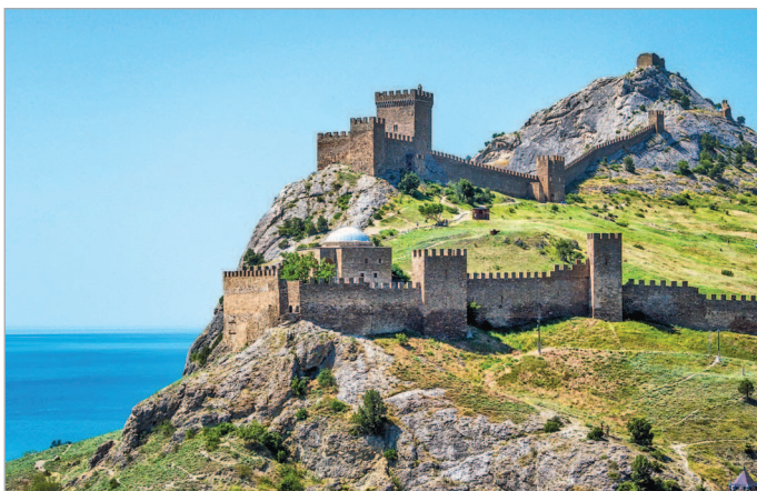
■ Генуэзская крепость в Судакe