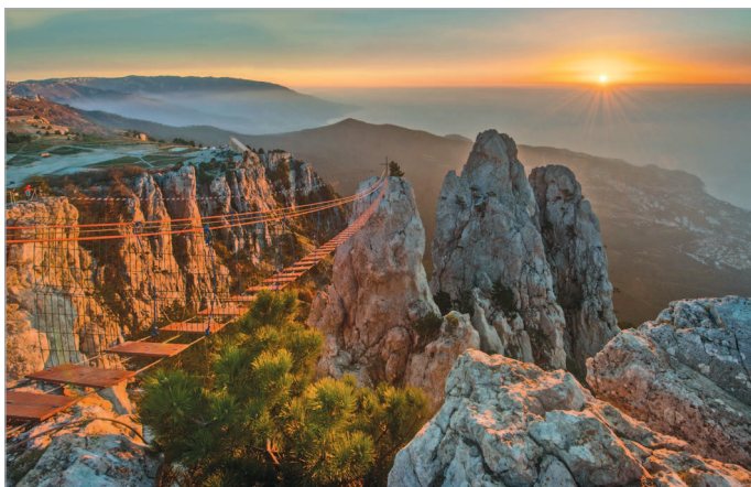
■ Закат на Ай-Петри