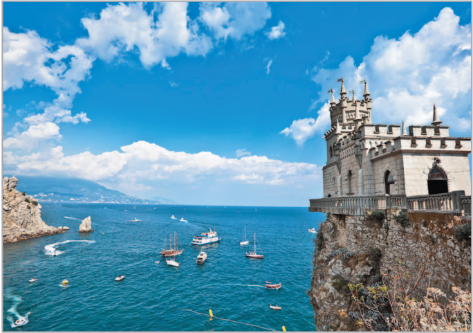
■ Ласточкино гнездо

Крым не оставляет равнодушных никого. Его прославляют, нежно любят, защищают, ожесточенно отстаивают, осуждают, критикуют. Слово «Крым» не сходит с уст, полос новостных лент и рейтингов. Так было во все времена. Этот полуостров в северной части Черного моря в разные эпохи был лакомым кусочком, яблоком раздора и ценным трофеем в битвах народов. В Крыму сосредотачивали стратегические силы, делали на него ставку. Здесь возводили неприступные крепости римляне, генуэзцы, турки, русские. Здесь проходил Великий шелковый путь и торговали греки, татары, евреи. Цивилизации не раз стирались с лица полуострова, и на их месте возникали новые. Крым побеждал, нес поражения, но каждый раз возрождался из пепла. Крым возвращал и возвращает на