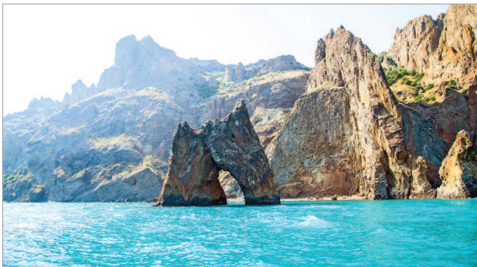
■ Скала Золотые ворота