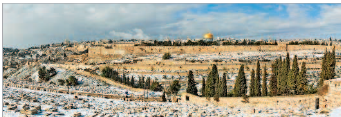
■ Вид с Масличной горы

дитесь по улочкам Старого города, по камням, на которых остались следы от самых известных нам трагедий человеческой истории. Неповторимая аура городской атмосферы оживит перед вашими глазами все виденное вами в фильмах или прочитанное в книгах об Иерусалиме! Здесь вы увидите библейские пейзажи, места , где правил мудрый царь Соломон, стены разрушенного Храма , оплакиваемого всеми иудеями, скалу, с которой пророк Мухаммед поднялся к небесам, и, конечно же, сможете пройтись последним путем Иисуса и его учеников.