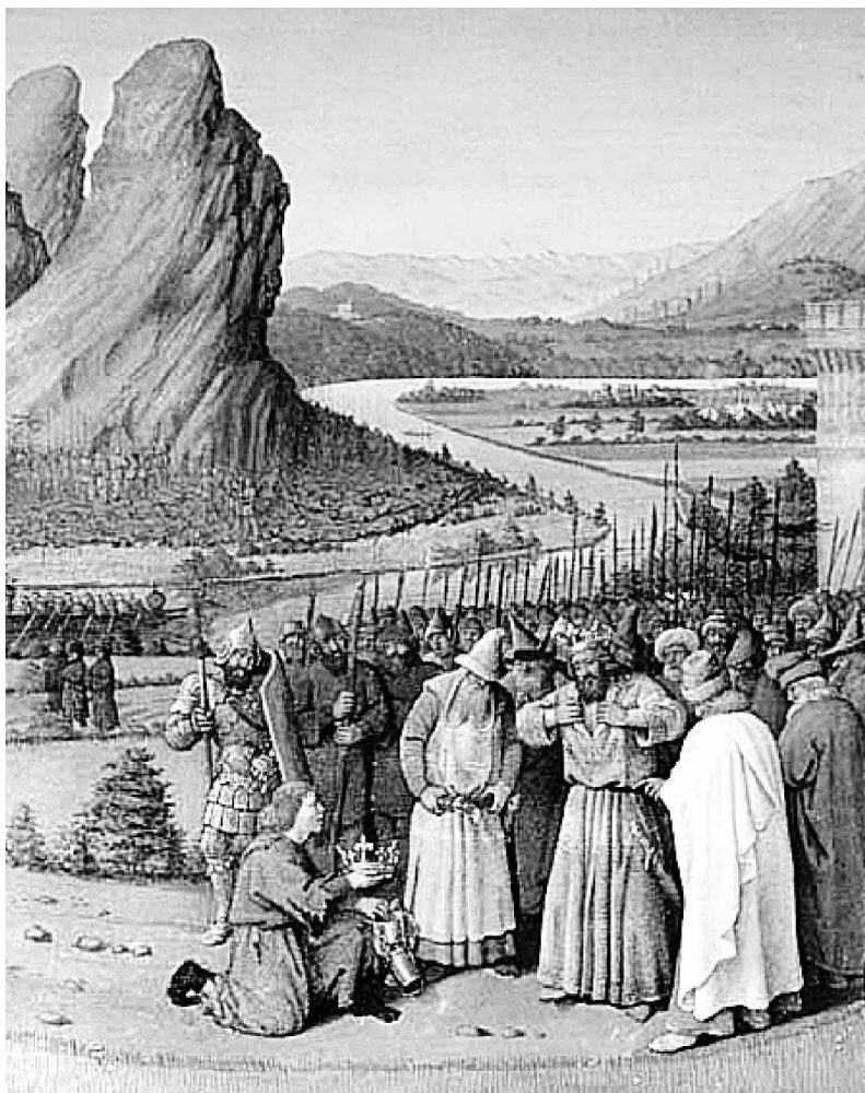
Жан Фуке. Давиду приносят новость о смерти Саула. Миниатюра из рукописи «Иудейских древностей» Иосифа Флавия. 1470 г.