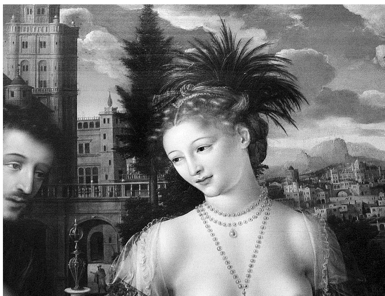
Ян Массейс. Давид и Вирсавия. 1562 г.

было политически правильно и, главное, дальновидно. Плоды усилий Давида стали очевидны уже в правление его сына, царя Соломона.