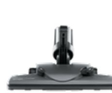
Универсальная насадка BORK COMBI