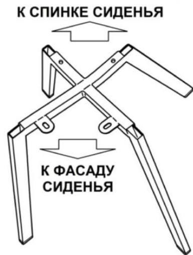
◀ Рисунок 2

ВАЖНО. Требуется проведение осмотра стула как минимум один раз в шесть месяцев или чаще (в зависимости от эксплуатации).