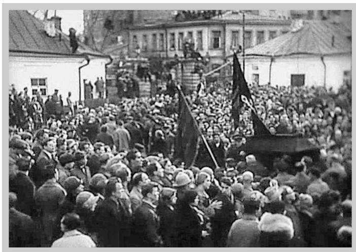
Похороны Маяковского, 1930.

Потом и того хуже: прямо за воротами кабака открыли, и житья не стало совсем, пока кабака этот не сгорел к чертовой матери, уж думаю, кто-то помог ему сгореть. Как мы тогда продержались эти годы, не знаю. Но это были в основном ночные ужасы, днем все было чинно-мирно и даже с каким-то культурным флером. Это когда в господском доме устроили дворец искусств, даже Есенин тогда приезжал. В голубой рубашке такой, весь раскудрявый, похожий на моего музыканта с отбитым мизинчиком, хорошенький. Один раз и я пошла посмотреть, что там за искусства такие. Есенина не видела, но публика собралась благородная, дамы хорошо одеты, курили, оставив пальчик, читали стихи нараспев и закатывая глазки к потолку. В ос-