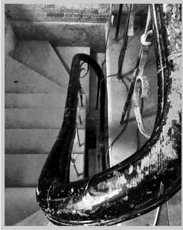
Лестница из библиотеки

плесенью не покрывается. Теперь из стены стали слышаться глухие удары, а иногда и скрежет, словно кто-то пальцами корябался, пытаясь стенку расковырять изнутри. Бедняга Алтын вообще из библиотеки сбежал, не вмоготу ему там было находиться, последнее время шарахался по углам, прятался, шипел и все шерсть топорщил. Родион стал читать заговоры, благо мудрых книг в библиотеке было множество и на все случаи жизни. Бывало,