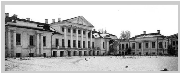
Усадьба Бодде-Колычевых, начало 20 века.

Все наше счастье из детства. Даже если оно, это твоё счастье огромное, ждет тебя в будущем, все равно ничто с тем, детским, счастьем не сравнится. Вероятно, это основа, мудро заложенная природой, на которую потом спокойно может наслаиваться все: обиды, измены, глупости, гадости, страсти — но счастливая эта детская «подушка», довольно весомая и могучая, не дает раствориться и пропасть. В таких особых ситуациях мысли уходят в те, чуть подзабытые воспоминания, когда все твои родные еще живы, молоды и бес-