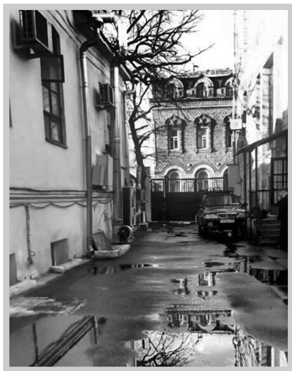
Окна нашего подвала — на уровне лужи