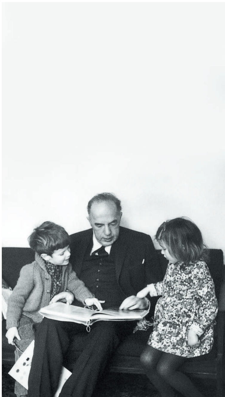
ЭРНСТ ГОМБРИХ СО СВОИМИ ВНУКАМИ КАРЛОМ И ЛЕОНИ, 1972