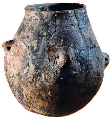
Глиняные горшки каменного века

Затем они научились обжигать глину в очаге и вскоре уже делали изящные сосуды, украшенные узорами. Но вот изображения зверей в это время, в новом каменном веке, на стенах уже не рисовали. И в конце концов примерно 6000 лет назад (или 4000 лет до нашей эры) появился новый, более удобный способ создавать орудия труда: люди открыли металлы. Конечно, не все металлы сразу. Сначала они нашли зеленые камни,