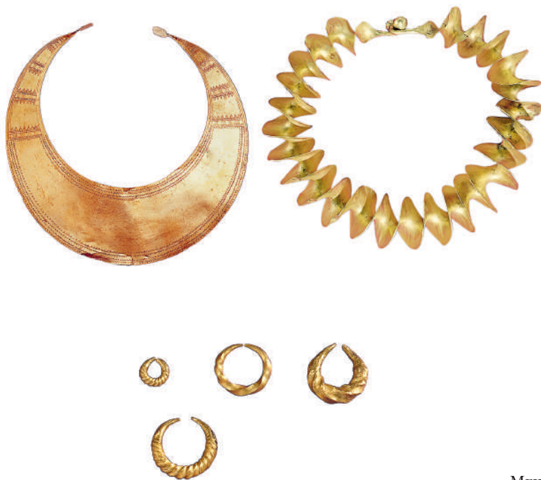
Меч и украшения БРОНЗОВОГО ВЕКА

Теперь давай представим, как люди, одетые в меховые одежды, плывут на лодках, выдолбленных из ствола дерева, к своим свайным деревням. Они привозят домой зерно или соль, добытую из-под земли. Они пьют