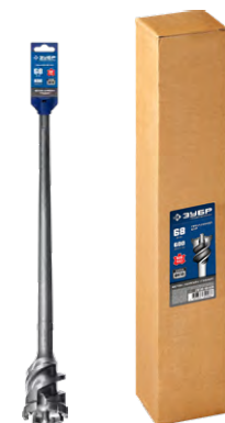
Упаковка: картонная коробка + подвес