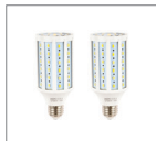
Лампа LED 30W, E27 2 шт.