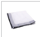
Рассеиватель 2 шт.