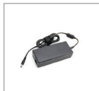
Адаптер 100-240V AC