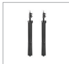
Стойка 200 см 2 шт.