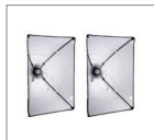
Софтбокс 50x70 см 2 шт.