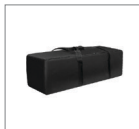
Сумка для переноски и хранения