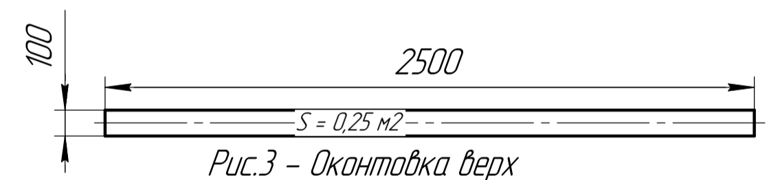
Рис.3 - Оконтовка верх

Расход гибкая пленка из ПВХ прозрачная M-Solar: (S= 4,822 м2) Тентовый материал из ПВХ лакированный, коричневый RAL8020: (S= 0,2+0,2+0,25+0,25=0,9 м2)