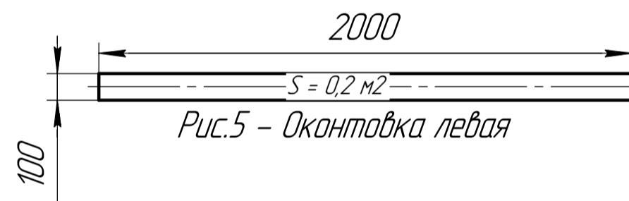
Рис.5 - Оконтовка левая