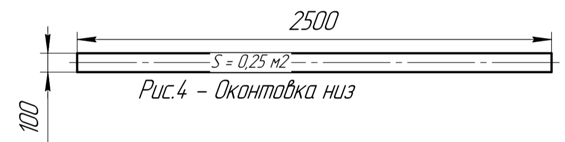
Рис.4 - Оконтовка низ