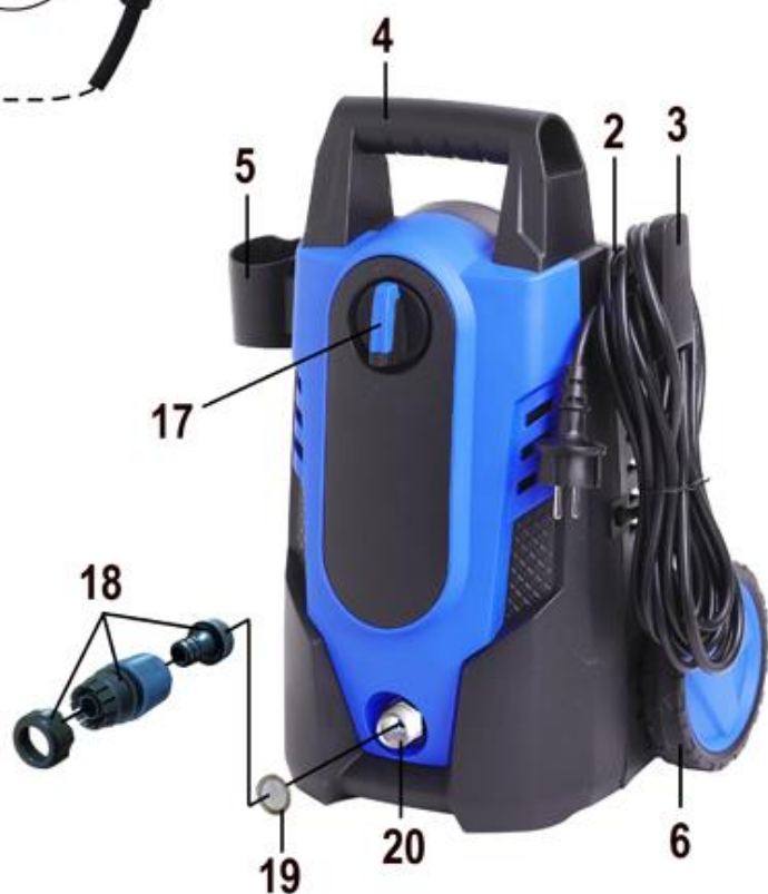
Рис. 1 Общий вид мойки

4.6. Система «Quick Connector» переходника подключения водоснабжения поз. 18 (входит в комплект поставки) позволяет осуществить легкое присоединение и отсоединение шланга водоснабжения (в комплект поставки не входит), что значительно экономит время и силы.