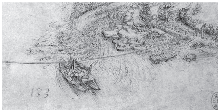
Леонардо да Винчи «Паромная переправа между Ваприо и Каноникой» (Windsor, RL n. 12 400)

красно известный ему рисунок, и тихо, про себя с восхищением восклицал по-английски: «Невероятно, чудесно, фантастика!» Угадать причину его оцепенения было совсем не сложно. Открывшийся перед ним мир Леонардо ошеломил старого английского ученого. К сожалению, это был знакомый нам пейзаж, по которому мы каждый день скользим взглядом, пейзаж, отмеченный лишь одним указателем на склоне со стороны Бергамо и щитом со стрелками на миланском берегу. Самое плохо исследованное, незащищенное и скверно охраняемое место. В южной части дома, вытянувшегося вдоль реки, в двух комнатах на нижнем этаже зимой укрывают лимоны в вазах. Широкие окна первой комнаты, больше похожей на оранжерею, обращены в парк и открыты полуденным лучам солнца. За ними, следуя против течения Адды, помещается библиотека, за ней танцевальный зал, потом бильярдная, зеленый зал и, наконец, угловой зал, называемый еще белым из-за мебели бледных тонов и большого светлого ковра. Зимой в танцевальном зале с венецианским полом находил приют стол для настольного тенниса, который с наступлением тепла выносили наружу, в портик. Упорная игра шла даже в са-