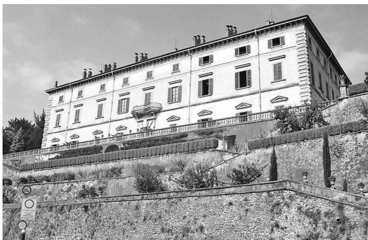
Вилла Мельци в Ваприо д'Адда

изобразил Леонардо на известном рисунке, хранящемся в Королевской библиотеке Виндзорского замка*. Довольно покатым, поросшим травой склон, круто обрывающийся над руслом Адды, остался точно таким же, с теми же мысами и излучинами.