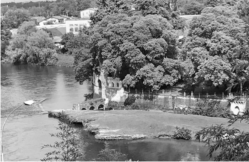
Вид на Адду между Ваприо и Каноникой

мые морозные дни, и после захода солнца стол освещался двумя светильниками «монгольфьер», которые мы временами обстреливали теннисными шариками, к счастью, без всякого вреда для этих светильников.