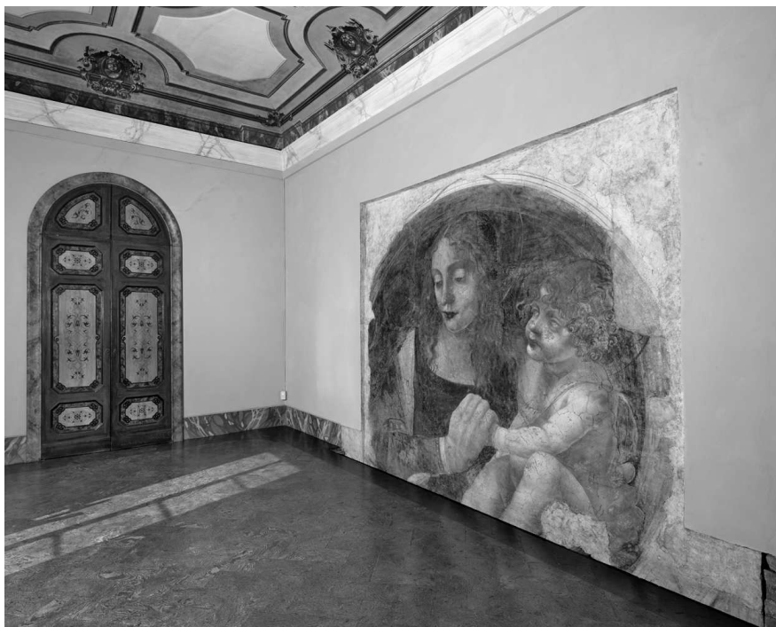
Фреска «Большая Мадонна» в доме Мельци в Ваприо

разгорится. Иногда капли воска стекали на покрывало и ковер алтаря, за что меня могли отругать, но в такую ночь любые упреки меня совсем не пугали.