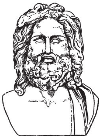
Зевс (с античной статуи)

поднял тело Тифона и низверг в мрачный Тартар, породивший его. Но и в Тартаре грозит еще Тифон богам и всему живому. Он вызывает бури и извержения; он породил с Ехидной, полуженщиной-полузмеей, ужасного двуглавого пса Орфа, адского пса Кербера, лернейскую гидру и Химеру; часто колеблет Тифон землю.