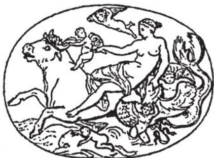
Амфитрита (с античной камеи)

слушны малейшему движению его руки, вооруженной грозным трезубцем. Там, в глубине моря, живет с Посейдоном и его прекрасная супруга Амфитрита, дочь морского вещего старца Нерея, которую похитил великий властитель морской глубины Посейдон у ее отца. Он увидел однажды, как водила она хоровод со своими сестрами-нереидами на берегу острова Наксос. Пленился бог моря прекрасной Амфитритой и хотел увезти ее на своей колеснице. Но Амфитрита укрылась у титана Атласа, который держит на своих могучих плечах небесный свод. Долго не мог Посейдон найти прекрасную дочь Нерея. Наконец открыл ему ее убежище дельфин; за эту услугу Посейдон поместил дельфина в число небесных созвездий. Посейдон похитил у Атласа прекрасную дочь Нерея и женился на ней.