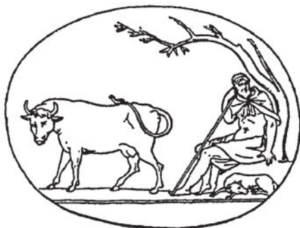
Аргус и Ио (с античной камеи)

кому не могла она поведать о своих страданиях; обращенная в корову, она была лишена дара речи. Не знающий сна Аргус стерег Ио, не могла она скрыться от него. Зевс видел ее страдания. Призвав своего сына Гермеса, он велел ему похитить Ио.