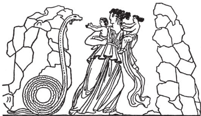
Пифон преследует Латону и ее детей, Аполлона и Артемиду (рисунок на вазе)

та Аполлон, и всюду разлились потоки яркого света. Как золотом, залили они скалы Делоса. Все кругом зацвело, засверкало: и прибрежные скалы, и гора Кинт, и долина, и море. Громко славили родившегося бога собравшиеся на Делосе богини, поднося ему амброзию и нектар. Вся природа вокруг ликовала вместе с богинями.