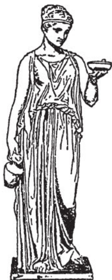
Геба (со статуи Торвальдсена)

Веселее становится пир олимпийцев. На этих пирах решают боги все дела, на них определяют они судьбу мира и людей.