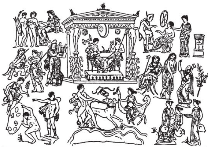
Царство Аида. В центре — Аид и Персефона (рисунок на вазе)

царства печали. Трехглавый адский пес Кербер 1 , на шее которого движутся с грозным шипением змеи, сторожит выход. Суровый старый Харон, перевозчик душ умерших, не повезет через мрачные воды Ахеронта ни одну душу обратно, туда, где светит ярко солнце жизни. На вечное безрадостное существование обречены души умерших в мрачном царстве Аида.