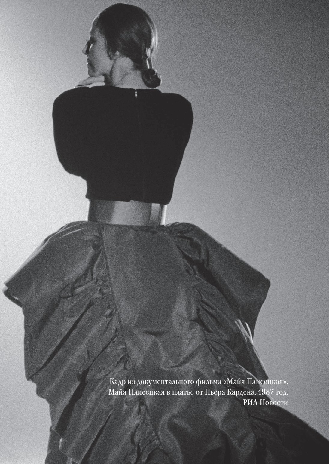
Кадр из документального фильма «Майя Плисецкая». Майя Плисецкая в платье от Пьера Кардена. 1987 год.