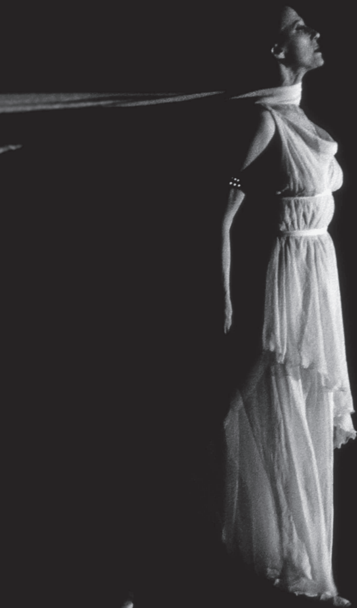
«Айседора». Юбилейный вечер. Большой театр. 1995 год.