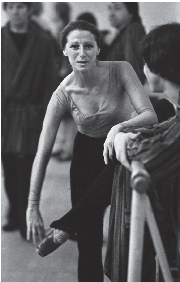
Майя Плисецкая. 1978 год.