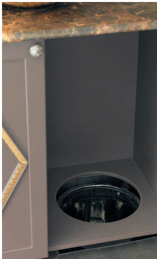
Бельепровод в тумбе под раковиной.