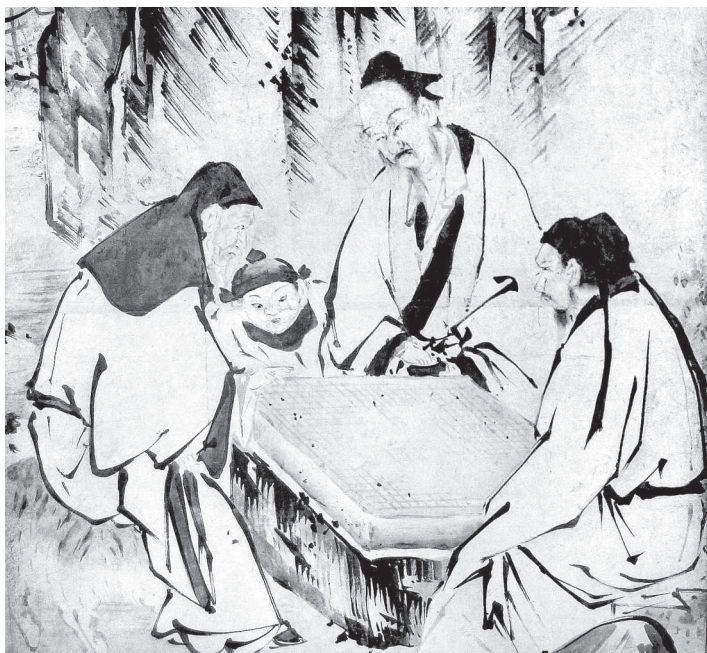
Картина Кано «Четыре мастера»

КАНО ЭЙТОКУ (1543 – 1590) – один из наиболее выдающихся японских художников, придворный художник сёгуната, основатель школы Кано для которой характерно сочетание реальных предметов или существ на первом плане картины, с чем-то абстрактным на заднем плане (облака, призрачный лес, выступающие из тумана горы). Заказчиками Кано Эйтоку были такие известные личности, как Ода Нобунага и Тоётоми Хидэёси.