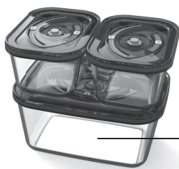
Контейнеры для вакуумирования (в комплектацию не входят, приобретаются отдельно)