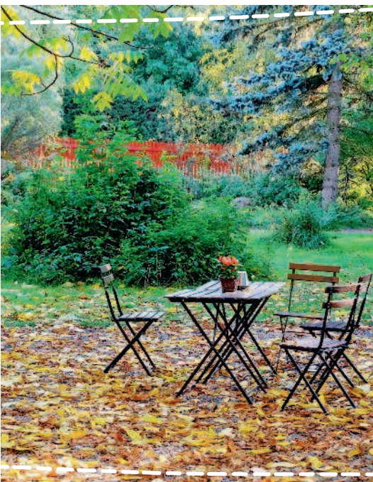
Сад в лесу

из земли сосну, требуется поистине ураганный ветер. Сосновый бор светлый, под его пологом прекрасно живут многие растения, в том числе и культурные, а потому его надо просто проредить.