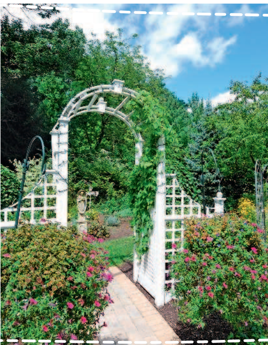
Часть сада в регулярном стиле