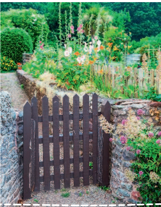
Сад с подпорными стенками