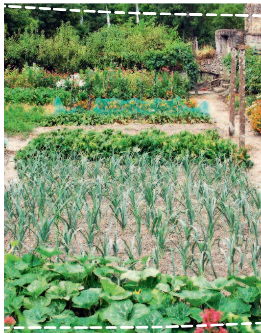
Огород может быть красивым