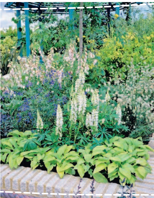
Миксбордер из многолетников

батки или бордюры вдоль дорожек. Дорожки в регулярном саду надо делать несколько шире, примерно 75–80 см, чтобы легко провозить по ним тележку, газонокосилку или пронести два ведра.