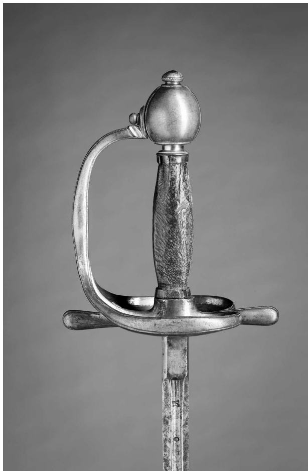
Кавалерийская офицерская шпага с оправой из позолоченной латуни, 1700 г. Из собрания Королевской сокровищницы, Стокгольм

В состав шведской армии входили Шведский, Померанский, Бремен-Верденский, Эстляндский и Лифляндский полки и эскадроны дворянского знамени, выставлявшиеся за счет богатых дворян провинций королевства. Шведский полк дворянского знамени состоял из 8 рот по 100 человек. Наиболее малочисленными были Померанский и Бремен-Верденский эскадроны дворянского знамени. Они насчитывали 160 и 147 человек соответственно 1 .