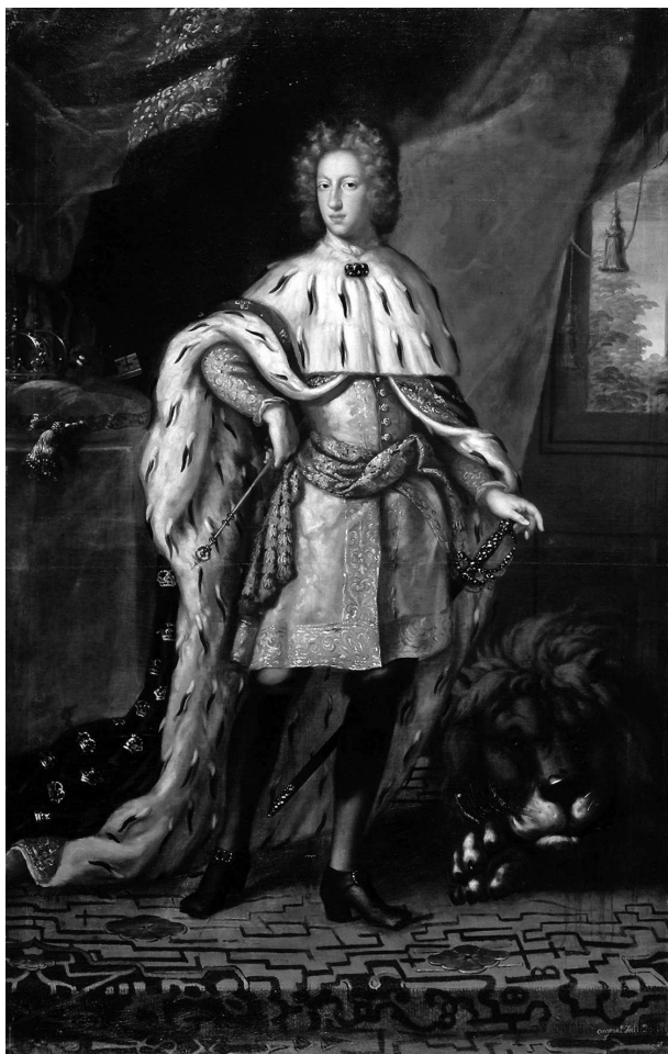
Король Швеции Карл XII в коронационном костюме в окружении символов королевской власти. Давид Клёккер-Эренстраль, 1697 г. Национальный музей Швеции

Король из-за большой протяженности театра боевых действий не мог лично оперативно влиять на ход событий. Поэтому в Финляндии, Ингерманландии, Эстляндии, Лифляндии и Курляндии все функции управления войсками были переданы командующим отдельными корпусами, что для того времени было новым и довольно смелым шагом. Король составлял только общий оперативный план действий, а частные начальники должны были самостоятельно его реализовывать в соответствии с местными условиями.