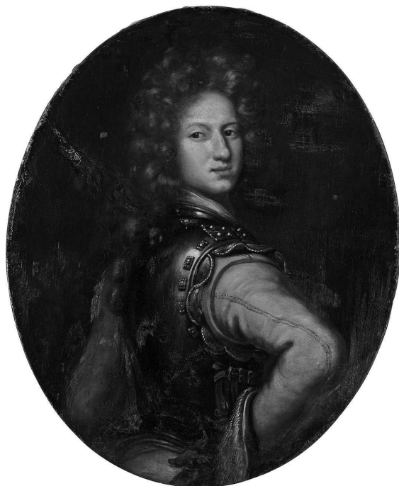
Пятнадцатилетний Карл XII в военной форме на портрете кисти Давида Клёккер-Эренстраля

Дальберг [18, Рр. 11–13], генералиссимус принц Фредрик фон Гесен-Кассельский обучался в Утрехтском университете (Нидерланды) [16, Рр. 29–31], а генерал-лейтенант барон Ханс Исаак Риддеръельм учился в Страсбурге (Франция).