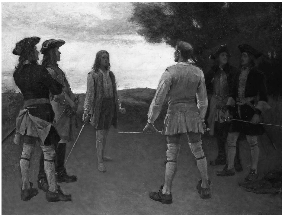
Дуэль между офицерами в шведской армии влекла за собой смертную казнь как для ее участников, так и для секундантов. Однако несмотря на строгий запрет, дуэли имели место. Картина Густава Улофа Седерстрёма под названием «Давид и Голиаф», 1918 г.

Надо сказать что шведские военные суды действовали активно. В то же время, при отсутствии достаточного снабжения, офицеры часто закрывали глаза на мародерство нижних чинов. Впрочем, если случаи неповиновения, мародерства и дезертирства были вопиющими, к части, в которой произошло подобное, применялась децимация. То есть каждый десятый военнослужащий по жребию подлежал расстрелу. У данного соединения изымались знамена, а личный состав направлялся на хозяйственные работы по лагерю. За кражи и воровство у своих товарищей полагался прогон сквозь строй и изгнание из полка. За оскорбление квартирных хозяев и уклонение от участия в богослужениях виновных заковывали в железо 1 .