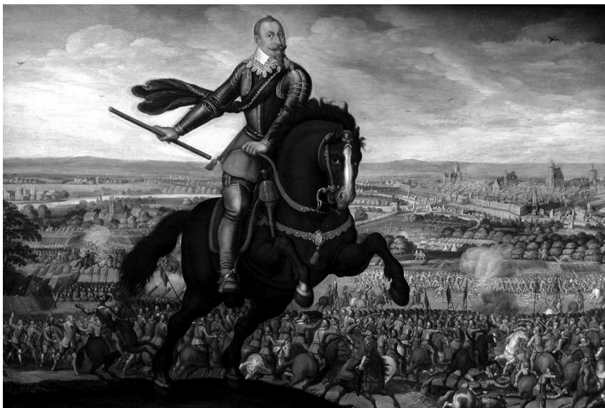
Шведский король Густав II Адольф на поле сражения при Брейтенфельде в 1631 г. Картина Иоганна Якоба Вальтера, 1632 г., из собрания Музея изобразительного искусства Страсбурга

Во многом, данный артикул базировался на римском праве, с дополнениями из нидерландского и германского права 1 .