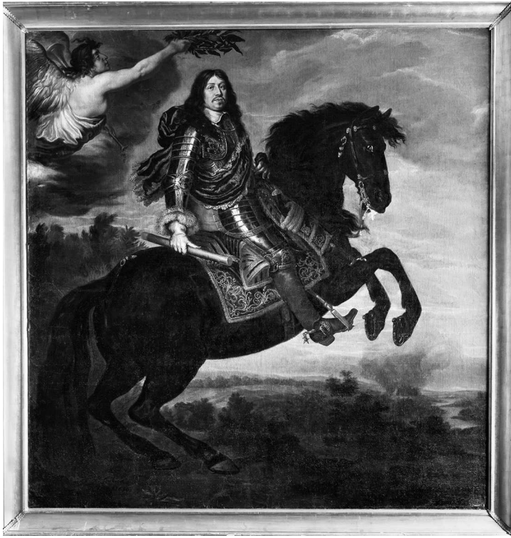
Конный портрет короля Швеции Карла X Густава в доспехах. Иоахим фон Сандрарт, 1650 г. Из собрания замка Скокlostер

Оскорбление офицера влекло отсечение руки, а в случае его гибели — повешение. Дуэль между офицерами влекла за собой смертную казнь не только для ее участников, но и для секундантов 1 .