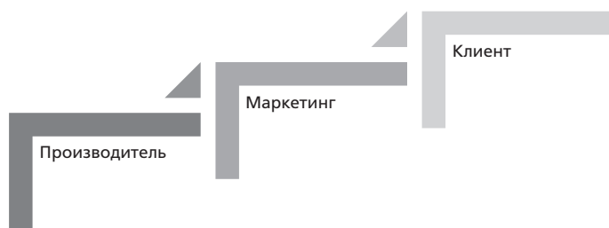
Рис. 1.1. Три этапа эволюции экономических отношений

Западные компании еще в середине XX века столкнулись с необходимостью изменить свое восприятие роли Клиента и сформировать к нему новый подход. Так пришло время вывести бизнес на очередной, новый уровень развития, и называется эта концепция — СЕРВИС .