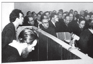
Процесс над Андреем Синявским и Юлием Даниэлем

псевдонимы Абрам Терц и Николай Аржак были раскрыты органами госбезопасности. Обоих писателей-«подпольщиков» арестовали в сентябре 1965 года и предъявили обвинение в «антисоветской агитации и пропаганде» (статья 70 Уголовного кодекса РСФСР). В печати развернулась «разоблачительная» кампания. Но она вызвала совсем