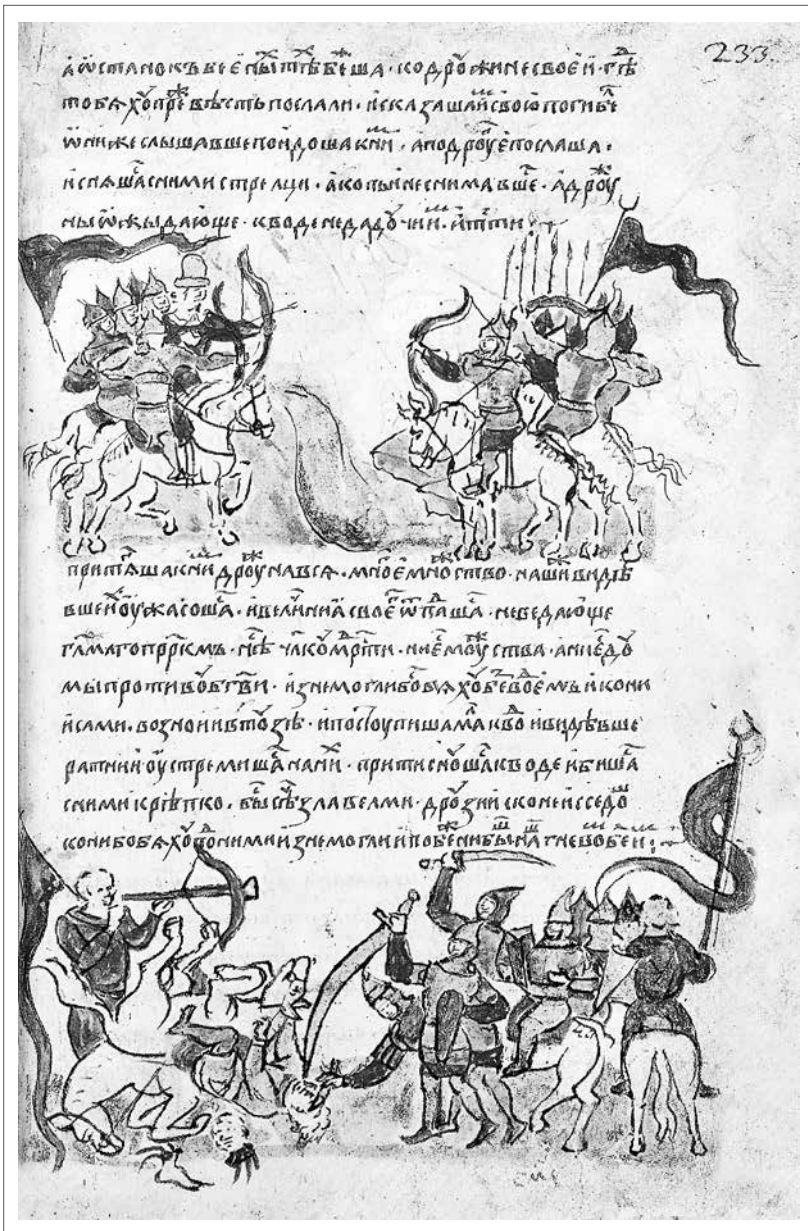
Битва Игоря Святославича с половецкими войсками на реке Каяле. Поражение русских войск. Две миниатюры из Радзивилловской летописи. Около XV века