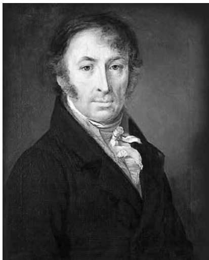
Василий Тропинин. Портрет Николая Карамзина. 1818 год. Карамзин посвятил Бояну первую главу «Пантеона российских авторов»

Полка. О главных книгах русской литературы