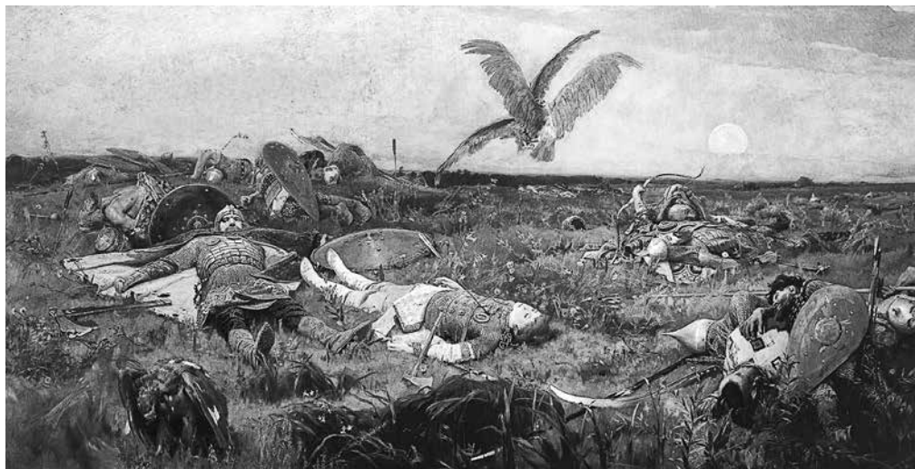
Виктор Васнецов. После побоища Игоря Святославича с половцами. 1880 год

А во время действия «Слова» Киевом владеет Святослав Всеволодович, глава клана Ольговичей. Это один из главных героев «Слова»,