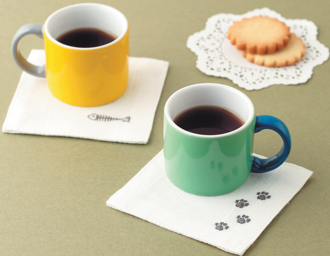
Фото на с. 43 (231, 232)

Следы кошачьих лапок. Забавные подставки под напитки будут радовать вас и ваших гостей.