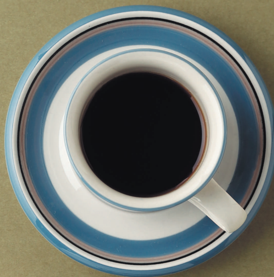
Фото на с. 37 (172)

Округлые формы. Черная кошка делает обложку паспорта уникальной.