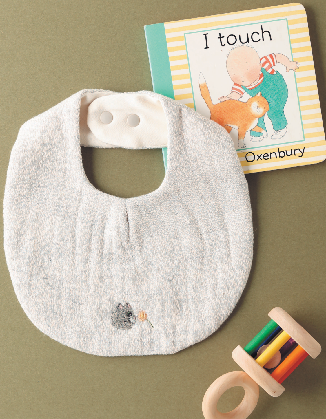
Фото на с. 40 (204)