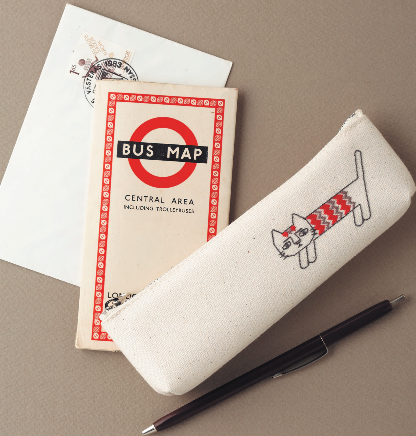
Фото на с. 42 (221)

Украшенный немного грустным, но милым котиком в скандинавском стиле пенал из тика.