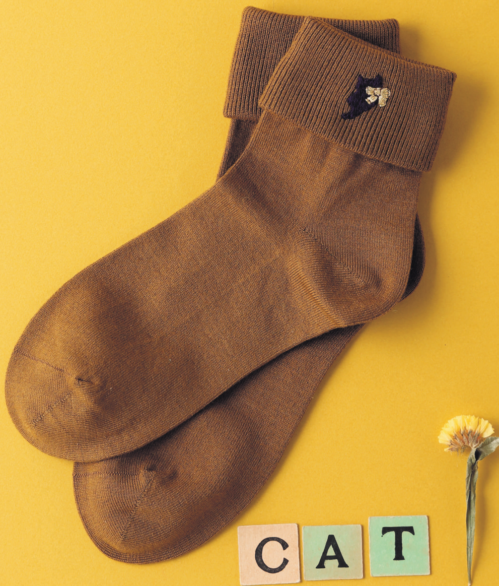
Фото на с. 31 (121)

Один маленький штрих превратит однотонные носки в стильный аксессуар.