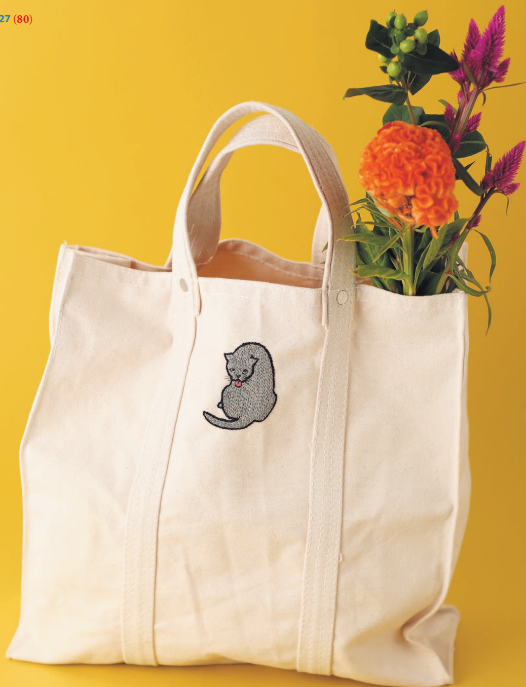
Фото на с. 27 (80)

Любой выход на прогулку станет еще веселее, если у вас есть шопер с озорным котенком.