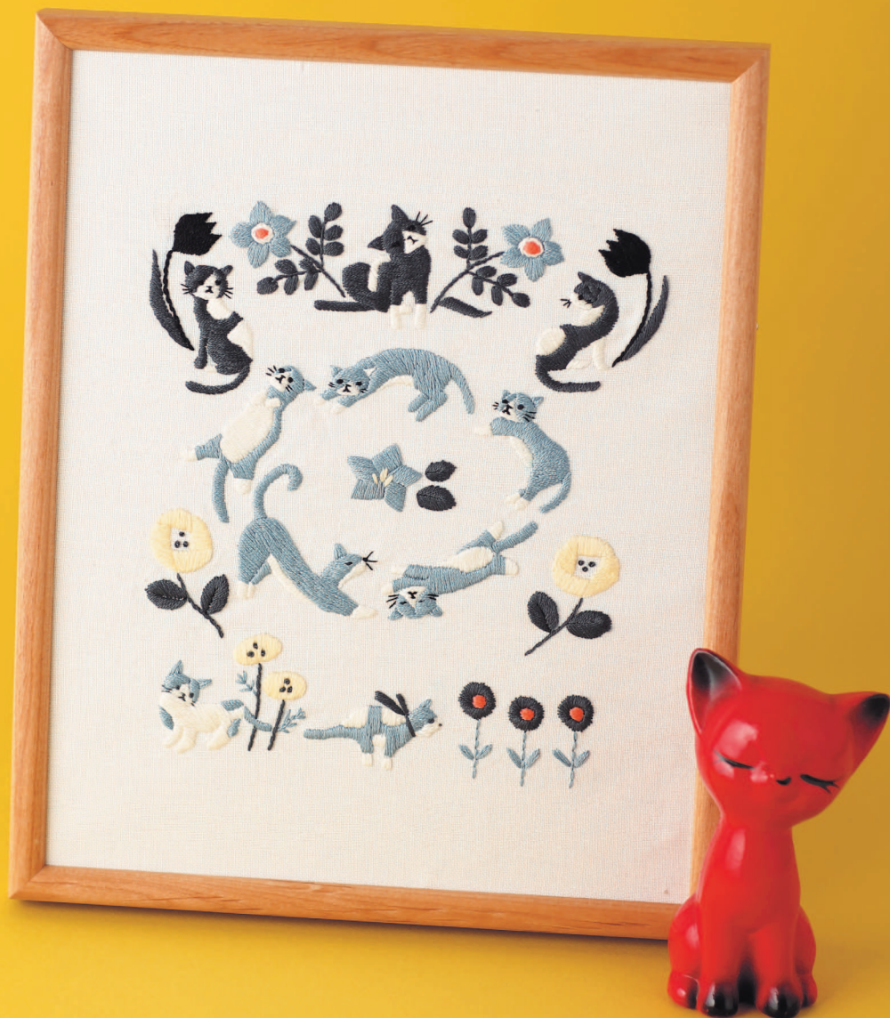
Фото на с. 32 (122–137)

Вышивка в рамочке — отличное дополнение к интерьеру.