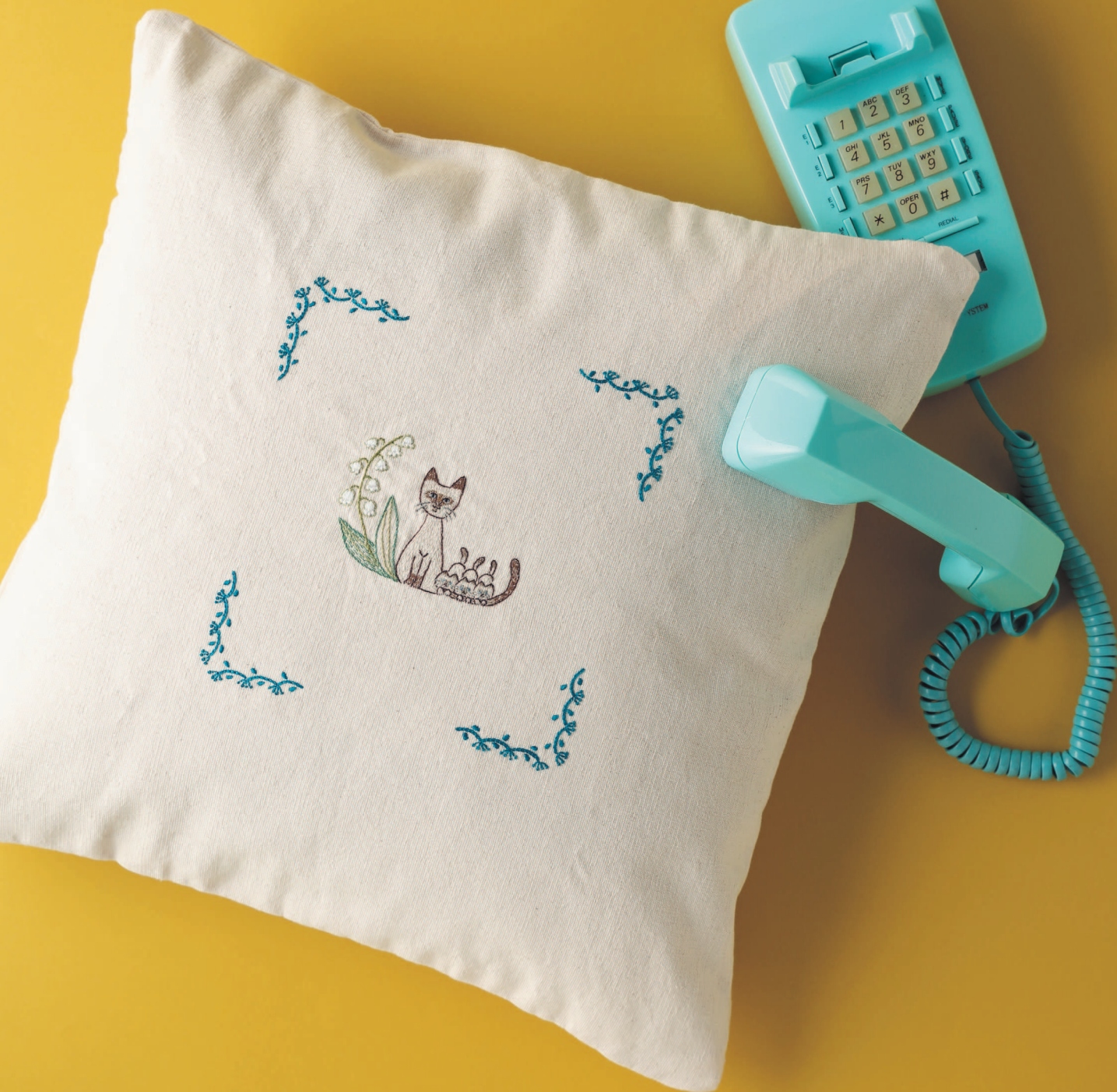
Фото на с. 20 (1, 2)

Подушка с цветочными узорами и кошечками украсит комнату.