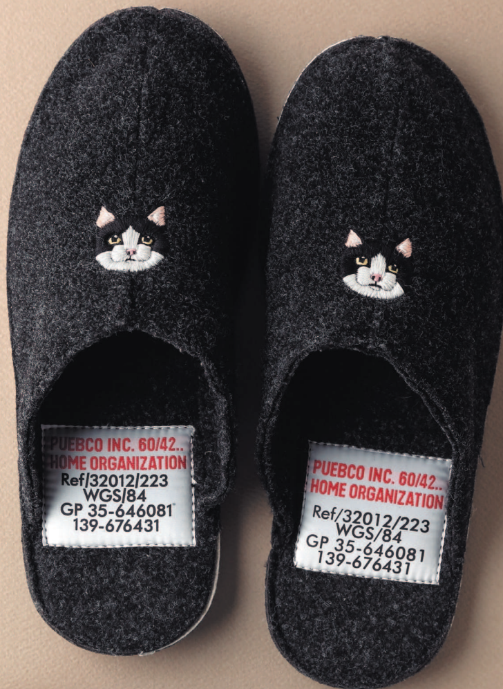
Фото на с. 24 (48)

Домашние тапочки с кошечками согреют вас в самый холодный зимний день.