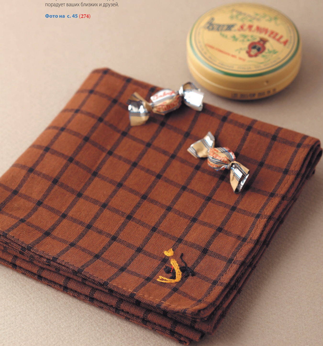
Фото на с. 45 (274)

Носовой платок с «кошачьими» инициалами в качестве подарка порадует ваших близких и друзей.