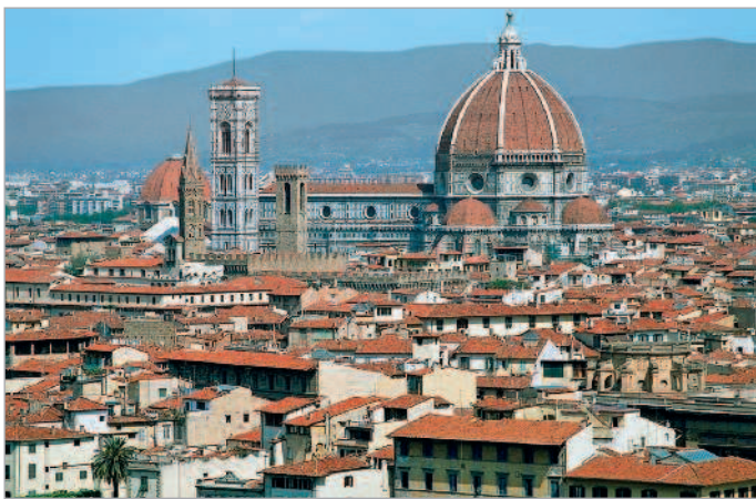
■ Панорама Флоренции

итальянских чудесах. Я честно сказал «почти полное», потому что, конечно же, венецианских каналов нигде, кроме Венеции, не увидишь, только в Болонье есть первый в Европе университет, любоваться по утрам из окна гостиничного номера солнцем, восходящим из-за Везувия, можно только в Неаполе... Понятно, что каждый город — от Рио-де-Жанейро до Серпухова — имеет нечто свое, уникальное. И не так уж много тех, что вмещают в себя не только главные сокровища страны, но и нечто много большее, что принято называть загадочным словосочетанием «дух народа». Пожив в таком городе хотя бы некоторое время, можешь сказать: я узнал Италию.