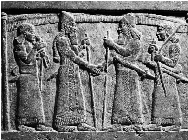
Рис. 1.2. Рукопожатие ассирийского царя Салманасара III и вавилонского правителя на барельефе IX века до нашей эры

Хотя по степени мучительности с кавади могут состязаться очень немногие ритуалы, есть немало других, подобных ему по тяжести. Например, в испанском городке Сан-Педро-Манрике 23 июня начинается ритуал летнего солнцестояния. В небольшое поселение с шестью сотнями жителей съезжаются до трех тысяч зрителей, желающих понаблюдать за тем, как желающие будут проходить семиметровую дорожку из горящих углей, соблюдая давнюю местную традицию. Некоторые делают это во исполнение обета, данного