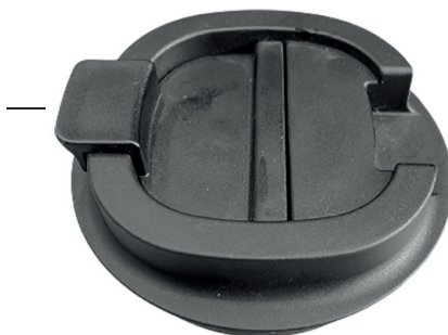
Клапан в закрытом положении