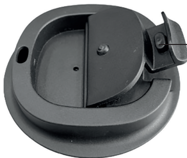
Клапан в открытом положении

Примечание. Находящийся внутри термокружки напиток может быть очень горячим. Проверяйте температуру напитка перед тем, как сделать глоток.