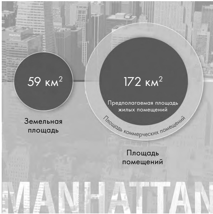
Илл. П 1. Площадь помещений в Манхэттене с учетом площади всех этажей в зданиях сегодня примерно в три раза превышает географическую площадь самого острова. Поскольку численность и плотность населения городов растут, скоро большая часть человечества будет жить в местностях, где площадь пола в помещениях превышает площадь участков земли. (По материалам, опубликованным Рабочей группой по эволюционной биологии застроенной среды, в статье «Эволюция биома жилых помещений», Trends in Ecology and Evolution , 30, no. 4 [2015]: 223–232.)