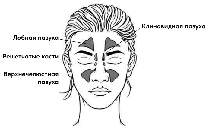
Рис. 2. Носовые пазухи

Существует несколько основных симптомов заболевания носовых пазух. Мы чувствуем некое давление в области лица; болезненность при любом прикосновении, часто переходящую в лицевую боль, исходящую из носовых пазух; отек и заложенность носа; неприятный привкус во рту, который сопровождается неприятным запахом изо рта; нарушение обоняния. Добавьте к этому влажный кашель, который не дает уснуть, и, конечно же, общую головную боль. Каждый из этих симптомов мы обсудим по очереди, но главный признак и «дирижер» всех этих проявлений заболевания — обычные сопли. Итак, давайте сначала рассмотрим суть проблемы.