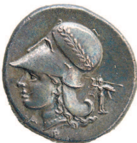
Позднее из подобных изображений рождаются также гербы государств

Считается, что прозвище «Юнона-Монета» появилось после того, как во времена войн Рима с эпирским царем Пирром она предсказала римлянам победу — в случае, если они будут вести войну справедливо