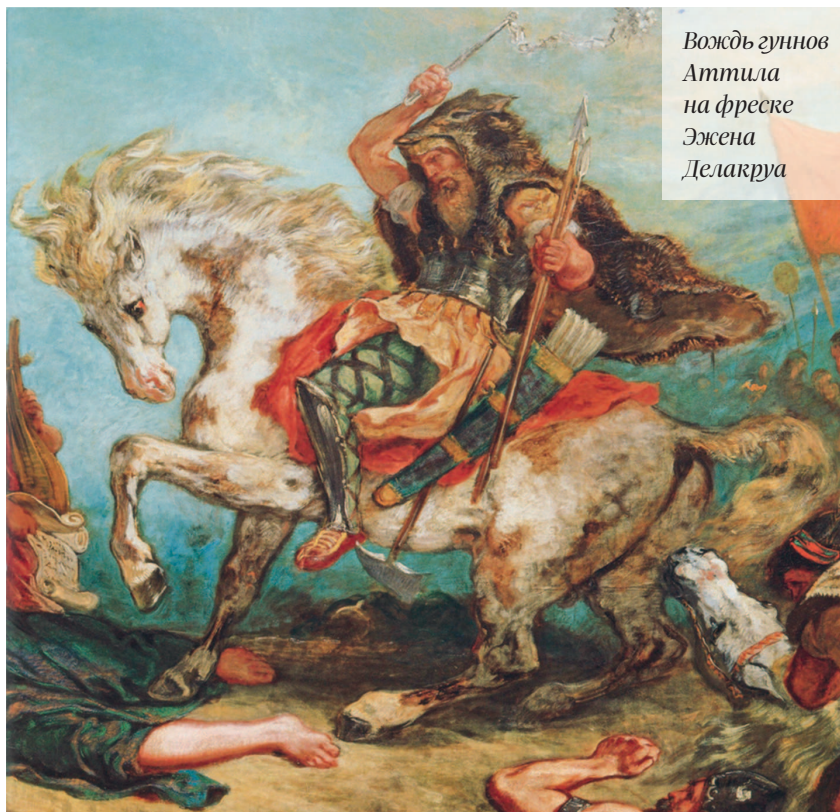
Вождь гуннов Аттила на фреске Эжена Делакруа

■ 50 ДЕНАРИЕВ ГУНТАМУНДА (кон. V в.) — одна из старейших сохранившихся варварских монет. Правитель вандалов Гунтамунд подражал римским образцам. И на монете скорее не варварский, а римский (византийский) правитель. «Варварские денарии» стали основой для других монет формирующихся государств Европы