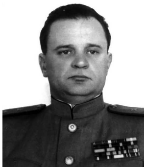
Генерал-лейтенант П.И. Ивашутин

В соответствии со стратегическим планом «Барбаросса» Гитлер и германский генералитет рассчитывали, что стратегическая цель — оккупация европейской части Советского Союза будет достигнута не позднее октября 1941 г.