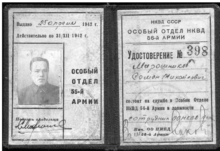
Удостоверение сотрудника Особого отдела

«Вероятно, никогда еще столько не говорили о войне, как теперь. В разговорах все сходятся на том, что если бич войны снова поразит Европу, то на этот раз война будет «всеобъемлющей» («тотальной»)¹. Это значит, что в борьбе будут участвовать не только люди, способные носить оружие, но будут мобилизованы и все ресурсы нации, в то время как авиация поставит самые отдаленные районы под угрозу разрушения и смерти».