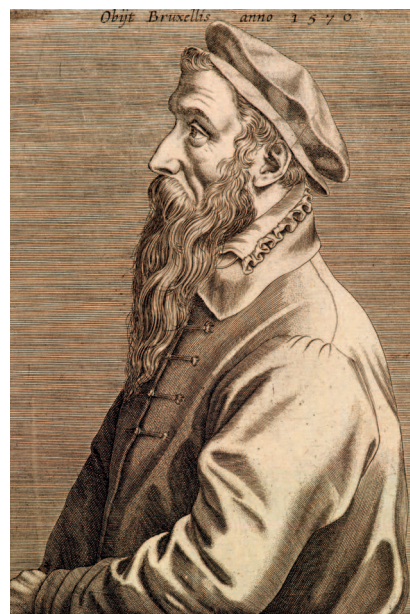
Сверху: Доминик Лампсоний. Питер Брейгель Старший. Гравюра. 1572. На этом посмертном изображении художник показан серьезным и даже величественным

На некоторых наиболее известных работах художника изображены крестьяне, поэтому живописца иногда называют Брейгелем Крестьянским. Некоторые специалисты считают, что