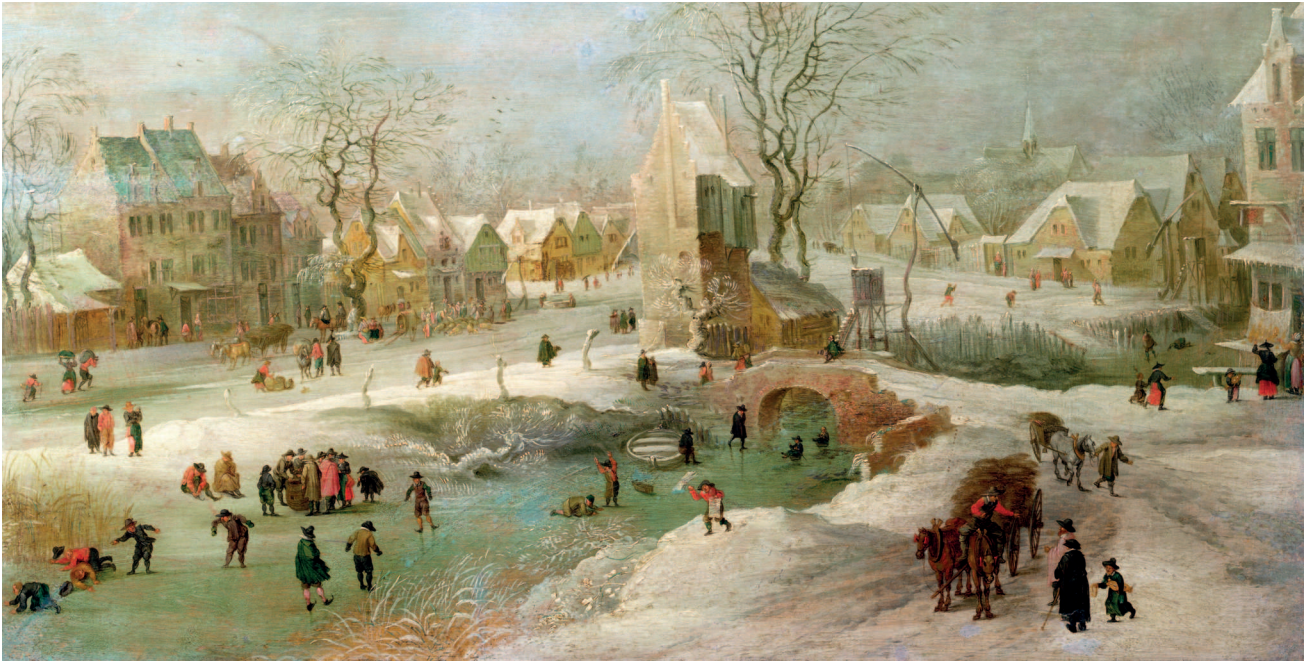
Сверху: Ян Брейгель Старший. Голландия зимой. Около 1600. Младший сын Брейгеля передал типичный городской зимний пейзаж, хотя в живописи он более изобретательный и творческий, чем его старший брат, Питер Младший

в 1568 г. Вазари лично знал некоторых мастеров, о которых писал. Он считается основоположником современного искусствознания. Вазари слышал о Брейгеле Старшем и называл его вторым Босхом.