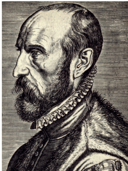
Сверху: Абрахам Ортелиус. Около 1575. Ортелиус был известным географом и близким другом Брейгеля Старшего. В своей «Книге друзей» он высоко оценивает творчество художника

К счастью, кроме Мандера существует и другой источник информации о жизни художника — Абрахам (Авра-