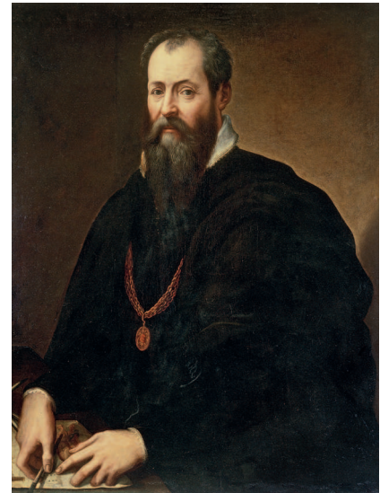
Сверху: Джорджио Вазари. Автопортрет. 1566—1568. Автор «Жизнеописаний» называл Брейгеля вторым Босхом

Итальянец Людовико Гвиччардини жил в Антверпене и был знаком