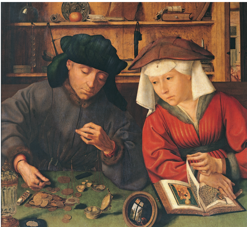
Сверху: Квентин Массейс. Меняла с женой. Около 1514. Прекрасная работа одного из предшественников Брейгеля Старшего, на которой художник с юмором, в реалистичной манере изобразил менялу с женой

наиболее выдающихся работ считается «Мадонна канцлера Ролена» (см. стр. 17), созданная в 1435 г. Пышно одетые канцлер и Мадонна на переднем плане внушительны, но взгляд зрителя скользит мимо сияющего интерьера, через арки — к далекому пейзажу речной долины, выполненному с мастерством отображения света и пространства.