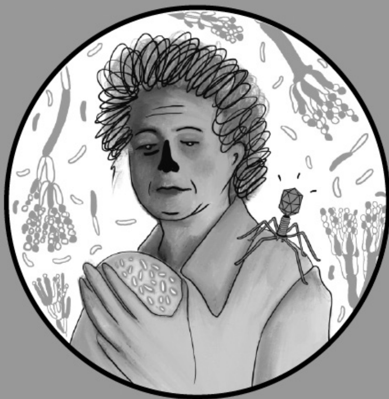
ЗИНАИДА ЕРМОЛЬЕВА Учёная-микробиолог