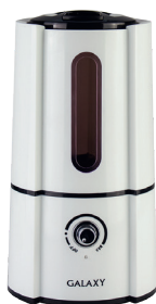
GL8003 УВЛАЖНИТЕЛЬ ВОЗДУХА УЛЬТРАЗВУКОВОЙ