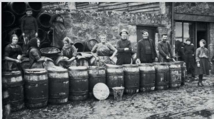
Промывка и засолка сельди. Анструтер, 1909 г. Фото из архива Шотландского музея рыболовства, SFM_1879