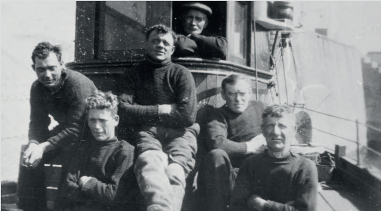
Команда рыбаков судна «Суд Всевышнего», порт Керколди.