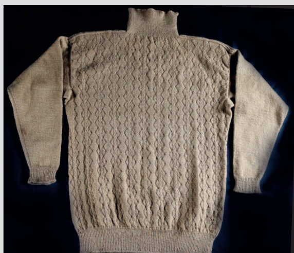
Узор с незавершенными (открытыми) «ромбами» и «ложный жгут» 2×2 п. Фрейзербург. Шотландский музей рыболовства, ANSFM2019.317