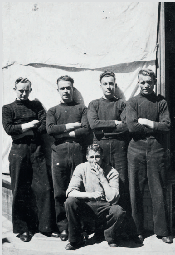
Групповое фото пяти питтенуимских моряков. Фото из архива Шотландского музея рыболовства, SFM_4567