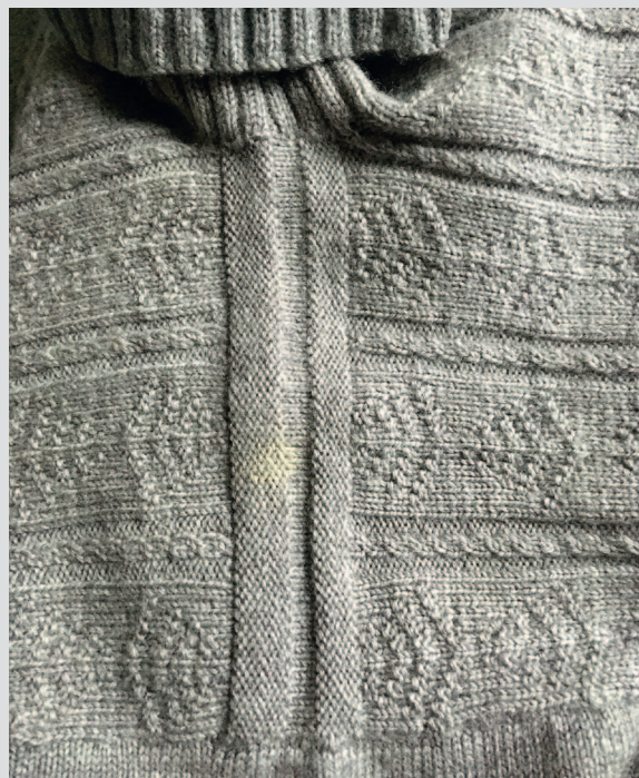
На гернсийском свитере с узором «дерево», связанным Беллой, хорошо видно плечевое соединение полосой-погоном.