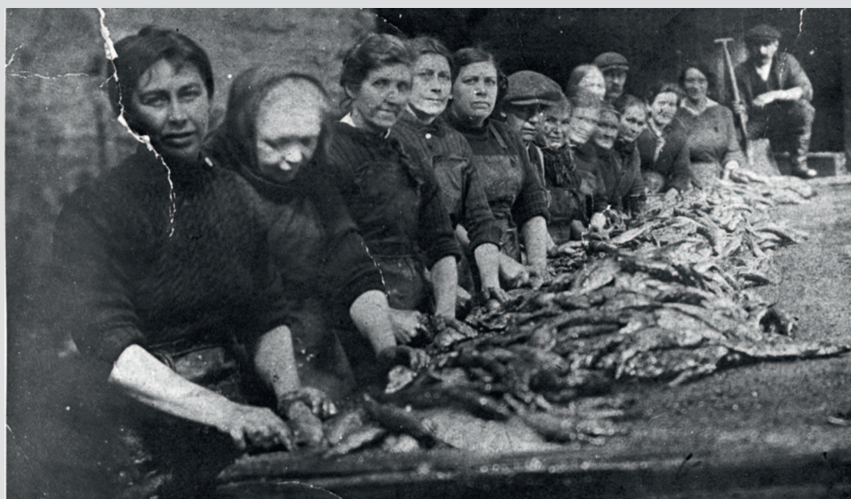
Заготовщицы сельди за работой во дворе дома Крейгов, Данбар, 1930-е, Шотландия. Фото из собрания Шотландского музея рыболовства, SFM_4075