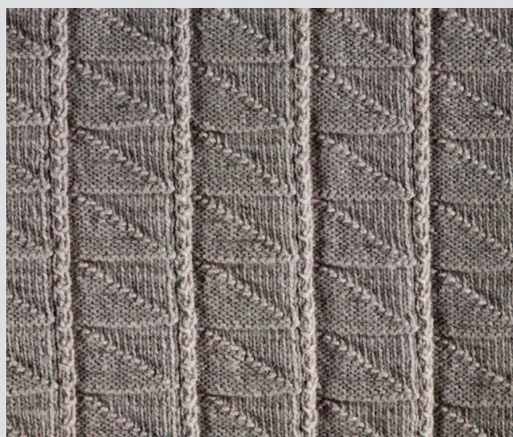
Узор «Уголки» и «ложные косы», Фрейзербург. Шотландский музей рыболовства, ANSFM 2019.374