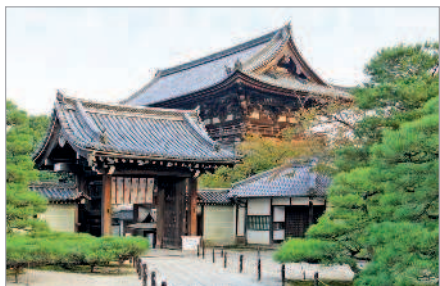
■ Киото, храм Ниннадзи

О существовании Японских островов Европа узнала только в начале XIV века от венецианского купца Марко Поло, который совершил путешествие в Китай. Самих островов Поло не видел, поэтому говорил о них как о Чипангу – Стране, где рождается солнце. Сами японцы до IX века называли свою страну Ямато – Большая гармония, а с X века – Нифон или Ниппон. В 1946 году Конституционная комиссия признала оба названия одинаково правомочными. Но когда в 1960-е годы страна готовилась к XVIII Олимпийским играм, вновь стал вопрос о названии. И Олимпийский комитет высказался за Ниппон – Начало Солнца. С тех пор именно так сами японцы называют свою страну. Ее флаг – красный солнечный диск на белом полотнище, и белый цвет говорит о чистоте помыслов, а солнце, как известно, символ японских императоров, ведущих свою родословную от богини солнца Аматэрасу. Когда японский флаг поднимается на флагштоке, звучит государственный гимн, начинающийся словами Кими га ё ва , что примерно означает «Пусть продлится Ваше господство». Под словом «Ваше» подразумевается, естественно, император. Официального герба страны не существует. В качестве него