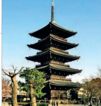
■ Храм Тогэи