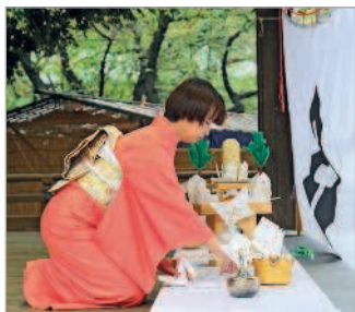
■ Чайная церемония

О существовании Японских островов Европа узнала только в начале XIV века от венецианского купца Марко Поло, который совершил путешествие в Китай. Самих островов Поло не видел, поэтому говорил о них как о Чипангу – Стране, где рождается солнце. Сами японцы до IX века называли свою страну Ямато – Большая гармония, а с X века – Нифон или Ниппон. В 1946 году Конституционная комиссия признала оба названия одинаково правомочными. Но когда в 1960-е годы страна готовилась к XVIII Олимпийским играм, вновь стал вопрос о названии. И Олимпийский комитет высказался за Ниппон – Начало Солнца. С тех пор именно так сами японцы называют свою страну. Ее флаг – красный солнечный диск на белом полотнище, и белый цвет говорит о чистоте помыслов, а солнце, как известно, символ японских императоров, ведущих свою родословную от богини солнца Аматэрасу. Когда японский флаг поднимается на флагштоке, звучит государственный гимн, начинающийся словами Кими га ё ва , что примерно означает «Пусть продлится Ваше господство». Под словом «Ваше» подразумевается, естественно, император. Официального герба страны не существует. В качестве него