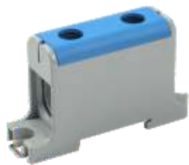
КВС 16-95 мм 2

YZN12-095-K03 YZN12-095-K07 YZN22-095-K52