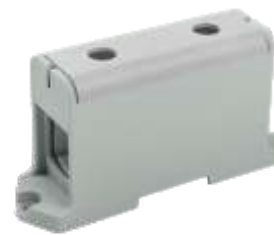
КВС 35-240 мм 2

YZN12-240-K03 YZN12-240-K07 YZN22-240-K52