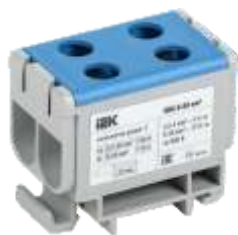
КВС 6-50 мм 2 Двухрядная

YZN13-050-K03 YZN13-050-K07 YZN23-050-K52