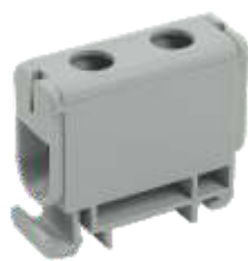
КВС 6-50 мм 2

YZN12-050-K03 YZN12-050-K07 YZN22-050-K52