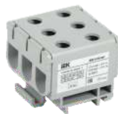
КВС 6-50 мм 2 Трехрядная серая

YZN13-095-K03 YZN13-095-K07 YZN23-095-K52