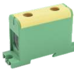
КВС 35-150 мм 2

YZN12-150-K03 YZN12-150-K07 YZN22-150-K52