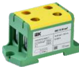
КВС 16-95 мм 2 Двухрядная

YZN13-095-K03 YZN13-095-K07 YZN23-095-K52