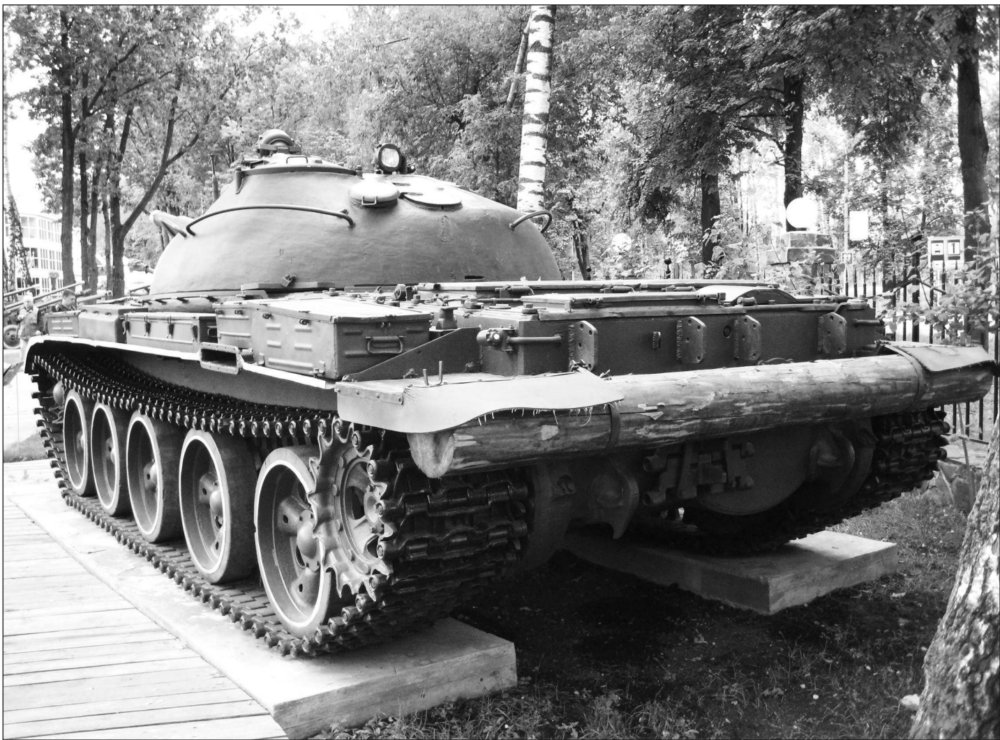
Средний танк Т-62, вид сзади