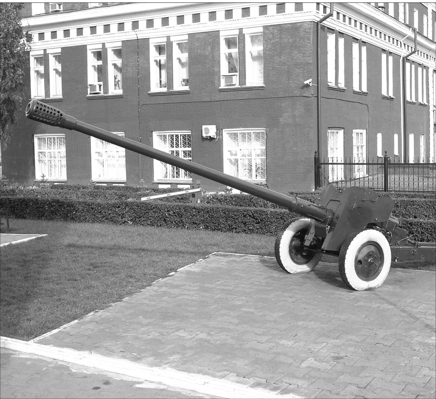
100-мм гладкоствольная противотанковая пушка Т-12