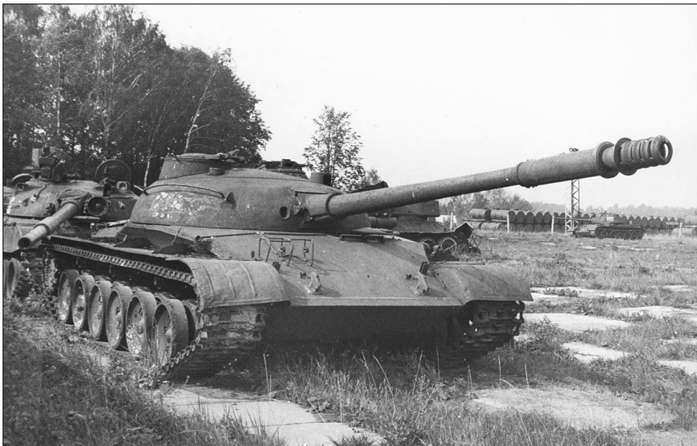
Опытный образец среднего танка «объект 140». Эта машина также вооружена 100-мм пушкой Д-54ТС

тормоз. При первом же выстреле дульная волна подняла снежное облако. Когда облако рассеялось, я увидел перед собой «слепой» танк. Снежная пыль попала на защитные стекла смотровых приборов и мгновенно превратилась в тонкую матовую ледяную корочку. Наиболее прочно обледенели приборы ме-