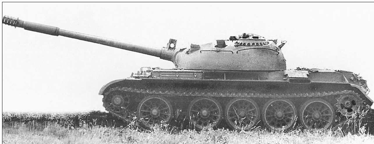
Опытный образец танка «объект 139» с пушкой Д-54ТС