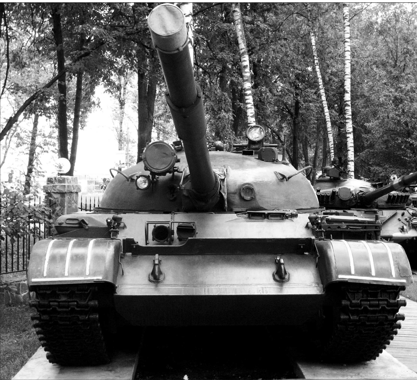
Средний танк Т-62. Вид спереди

В течение 1959 года было изготовлено несколько опытных образцов. К осени 1960 года машины успешно прошли полигонные испытания. Комиссия, проводившая их, рекомендовала принять танк на вооружение. Эффективность пушки У-5ТС была выше, чем у прародительницы – 100-мм противотанковой гладкоствольной пушки Т-12. Снаряды имели хорошую баллистику и