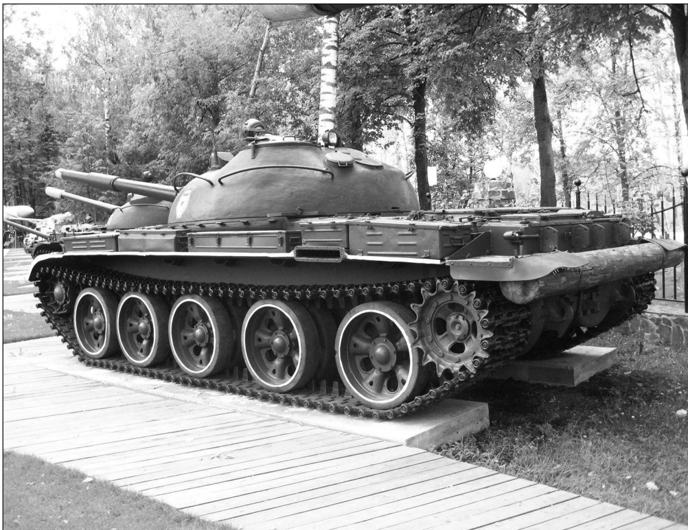
Средний танк Т-62, вид сзади сбоку