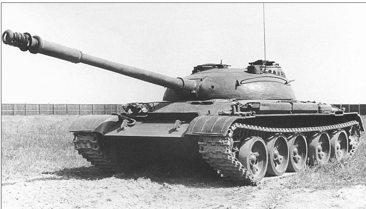
Опытный средний танк «объект 142». 1958 год

На меня дульный тормоз в принципе произвел резко отрицательное впечатление. Зимой он поднимал снеж-