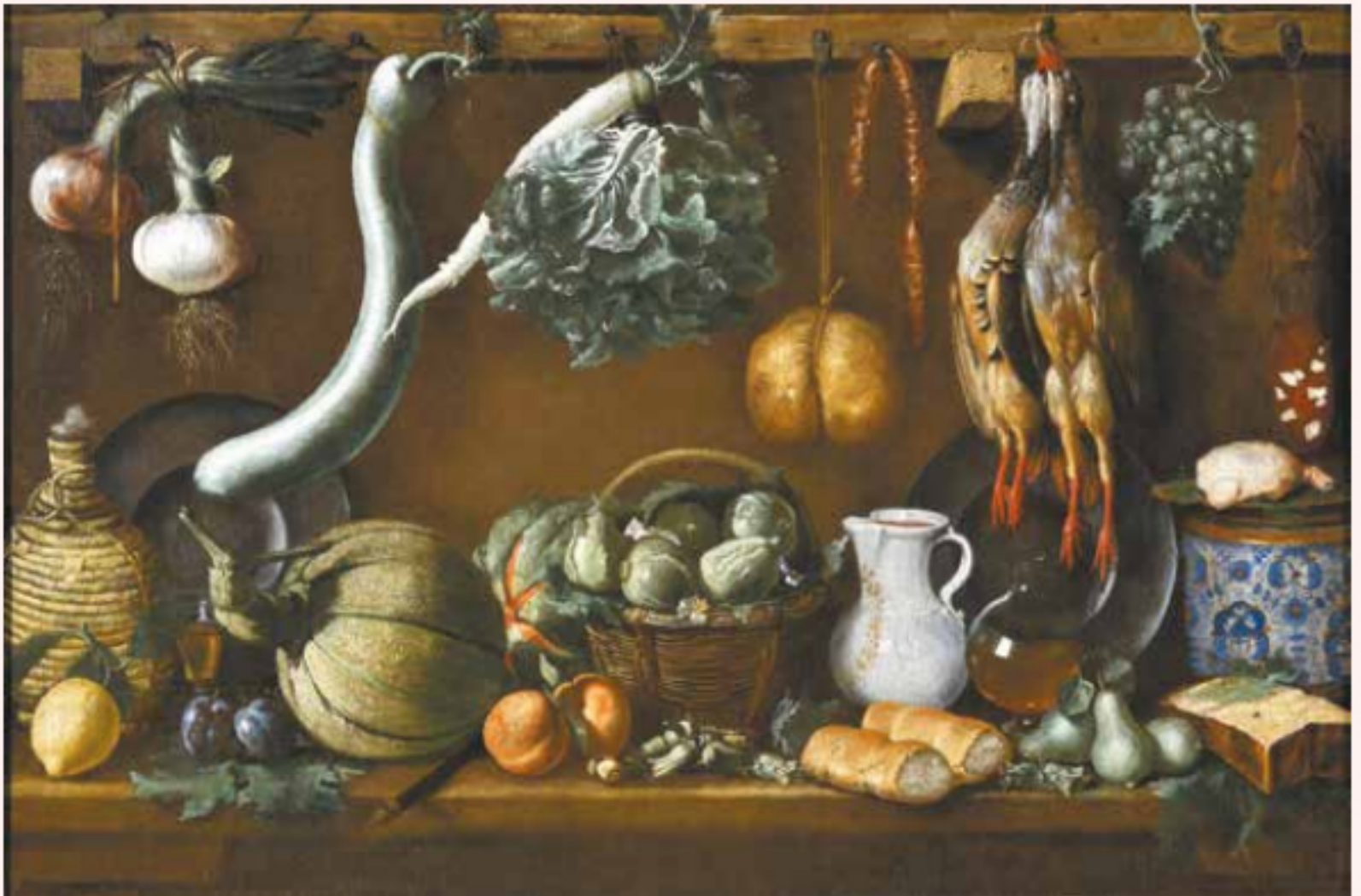
Якопо да Эмполи (Якопо Кименти). «Натюрморт», ок. 1625

Картина 1625 года итальянского художника Якопо да Эмполи « Натюрморт », принадлежащая коллекции Пушкинского музея, представляет собой уже полноценный натюрморт. Перед зрителем выложены овощи, фрукты, птица, хозяйственная утварь — все торжественно расставлено на переднем плане как на продажу. Такой тип натюрморта носил название «Лавка».