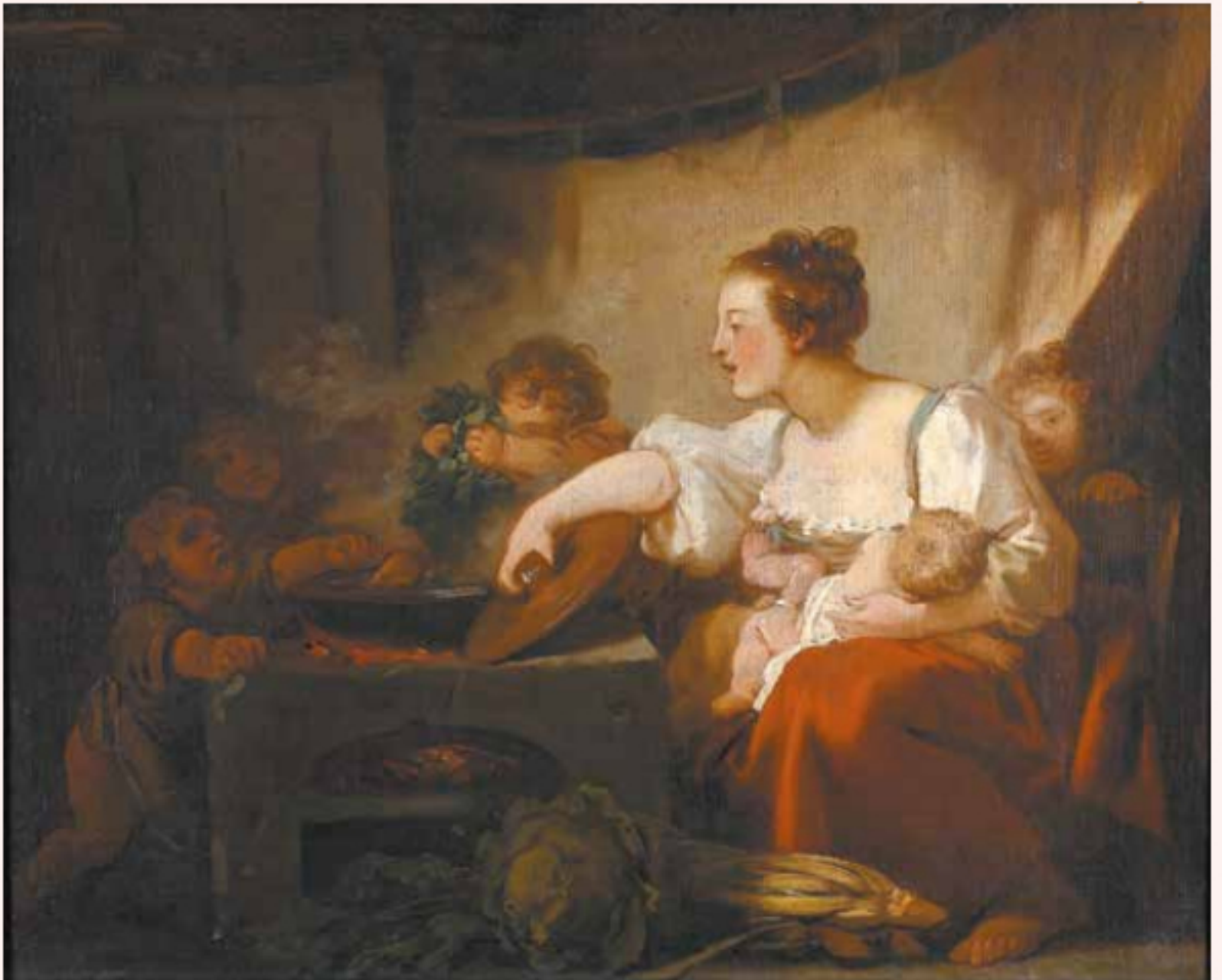
Жан Оноре Фрагонар. «Приготовление обеда» («Счастливое семейство»), 1756 (холст, масло)

Новое отношение общества к семье изобразил в середине XVIII века замечательный художник Жан Батист Шарден в картине «Молитва перед обедом». Она хранится в Государственном Эрмитаже, и это одна из важных картин этого собрания. Перед нами так называемые люди третьего сословия, нарождавшегося с начала XVII века класса, который будет потом определен как буржуазия. Шарден и его время относились к ним с большим уважением, и мы видим, что в этой семье господствуют патриархальные отношения — тепло и забота друг о друге.