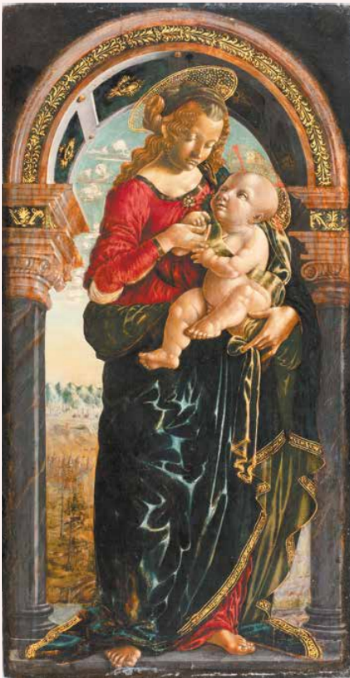
Предположительно, Бернардино Бутиноне. «Мадонна с Младенцем под аркой», ок. 1485–1495 (дерево, темпера, позолота)