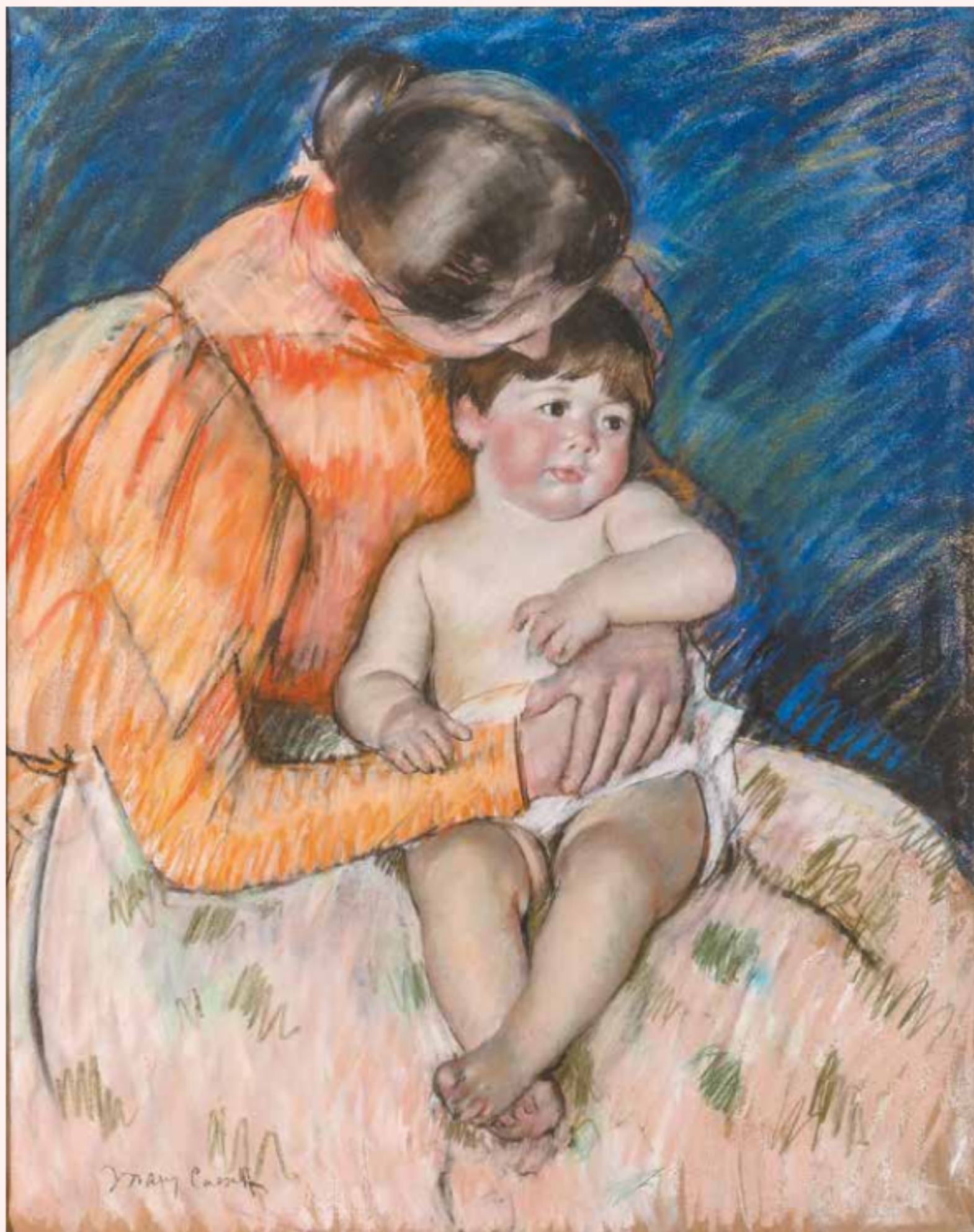
Мэри Кэссетт. «Мать и дитя», 1893 (бумага, пастель)