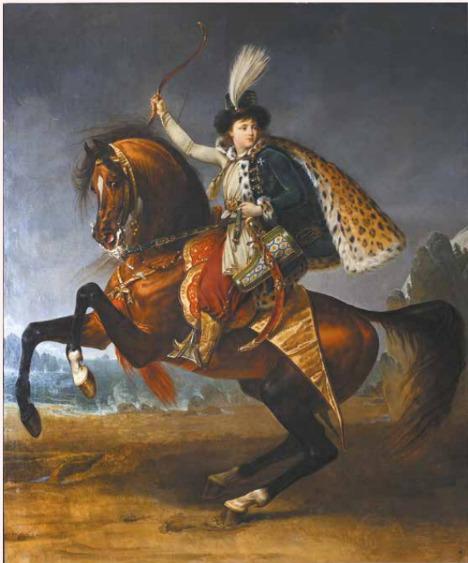
Антуан Жан Гро. «Конный портрет князя Б.Н. Юсупова», 1809 (холст, масло)