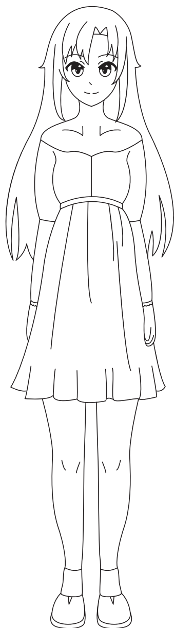
ПЕРСОНАЖ МАНГИ НАПРАВЛЕНИЯ СЁДЗЁ

Мир персонажей манги невероятно разнообразен — всё зависит от жанра. На страницах японского комикса ты можешь встретить обычных школьников, фантастических путешественников во времени и