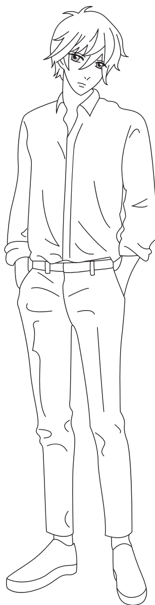
СОВРЕМЕННЫЙ ПЕРСОНАЖ МАНГИ