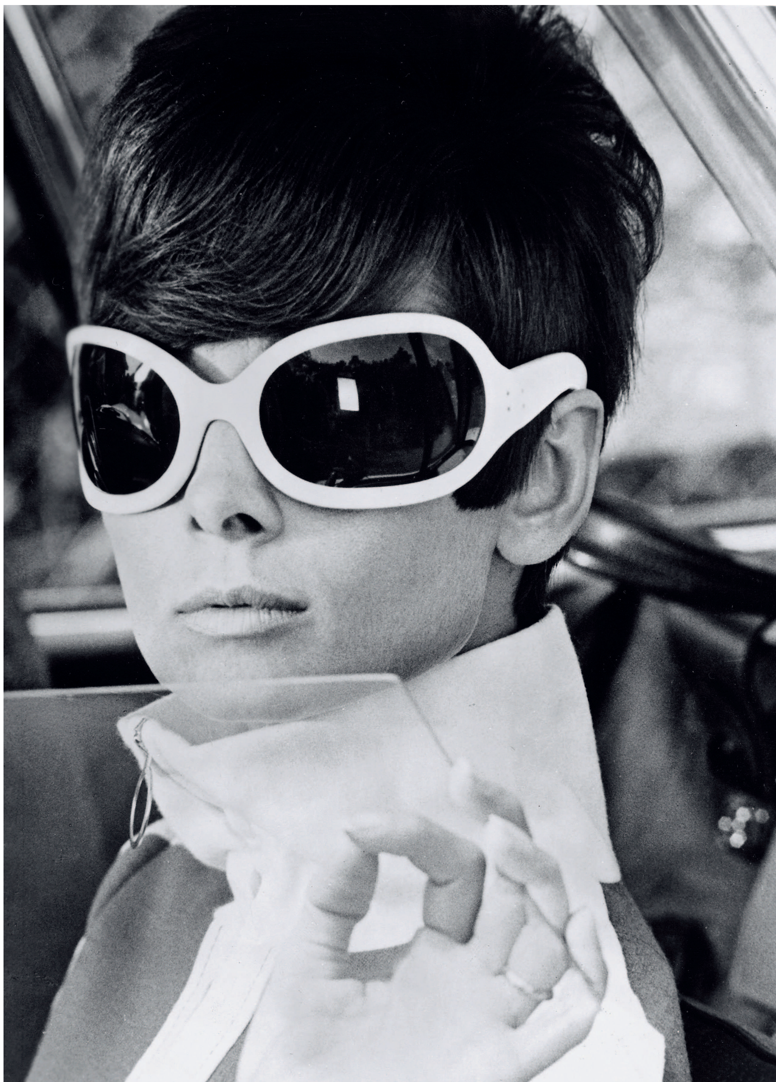
Одри Хепберн в фильме «Двое на дороге». На ней солнцезащитные очки от Куррежа, вариант его «эскимосских» очков.