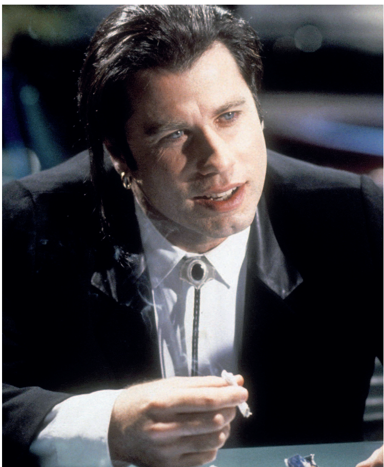
Костюмер Бетси Хайман добавила кожаные лацканы к черному костюму от Аньес Б., который Джон Траволта носил в «Криминальном чтиве», чтобы придать ансамблю нотку стиля рокабилли.