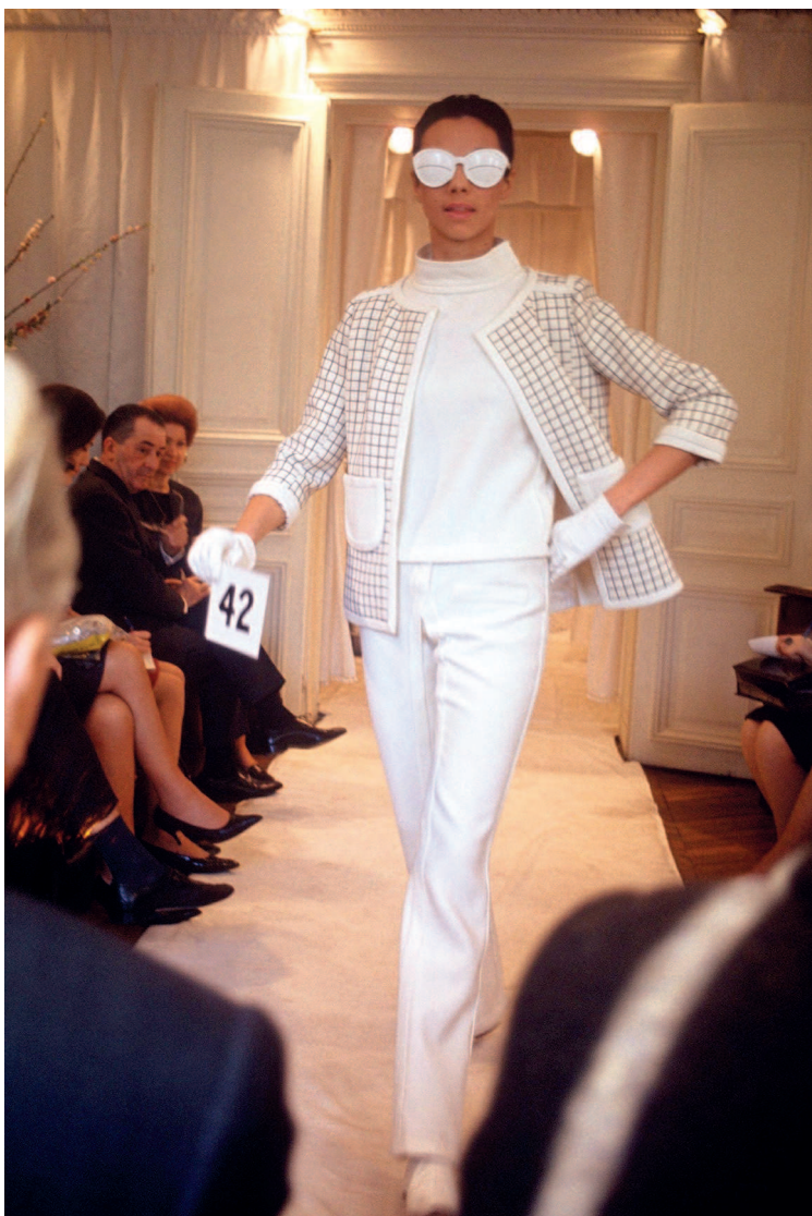
Знаменитые «солнечные очки эскимоса» от Куррежа, прототипом для которых стали снежные очки инуитов, впервые были показаны в коллекции «Лунная девушка» в 1965 году.

вклад был небольшим, но как часть дизайнерской эстетики Хепберн, выдержал проверку временем. Хепберн сыграла Джоанну, которая в начале картины предстает как простая наивная девушка и заканчивает ее как замужняя женщина на грани развода, облаченная с головы до ног в последние творения космической моды. Фильм «Двое на дороге» стал одним из самых культурно значимых проектов актрисы, так как он показал seismicкое изменение на рынке моды, которое актуально и сейчас. Юность одержала окончательную победу. Начиная с шестидесятых годов одежда предназначается для подростков, а взрослым женщинам, подобным Хепберн, бывшим когда-то завзятыми модницами, остается только играть в догонялки. Курреж предоставил для съемок картины «Двое на дороге» очки от солнца в своем фирменном «эскимосском» стиле — с прорезями для глаз, представленные в 1965 году. Но очки Хепберн в фильме все-таки более практичны.