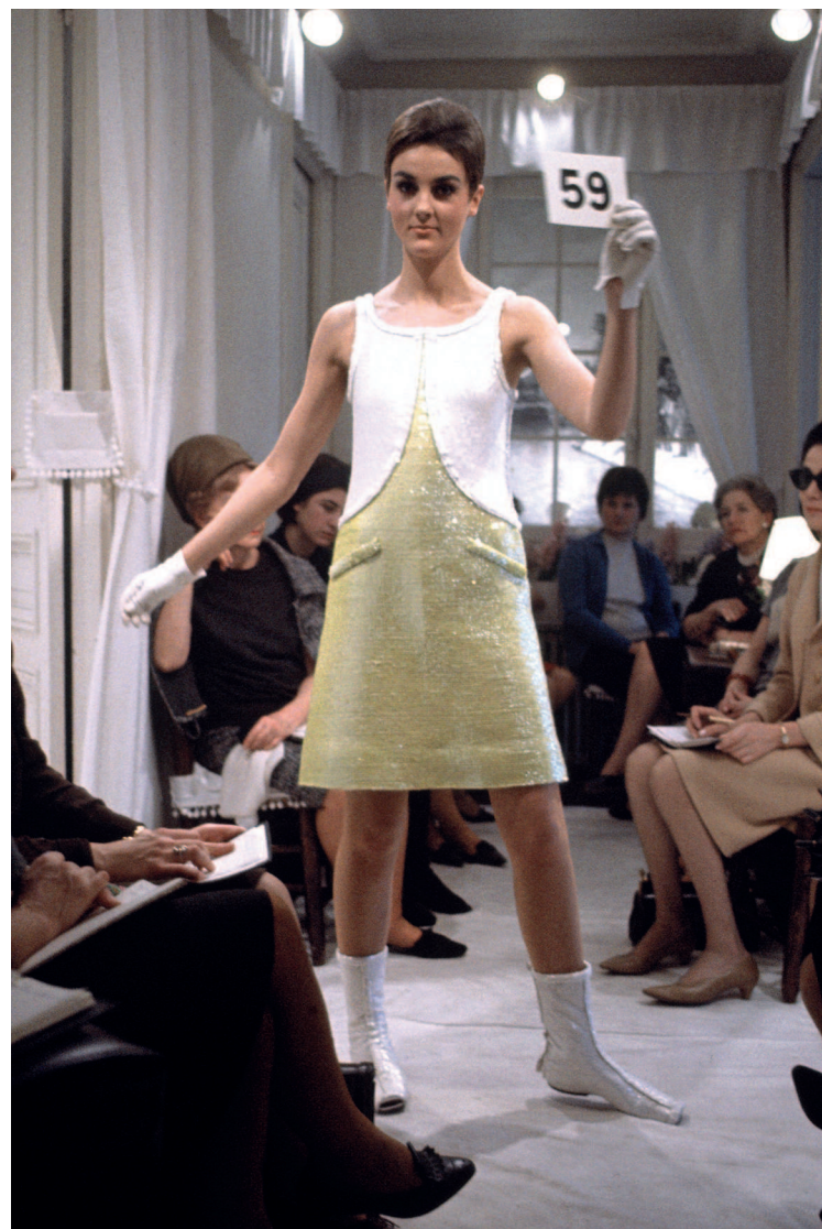
В 1960-х годах Курреж вместе с Мэри Куант популяризовал цельнокройное платье А-силуэта. Его творения были созданы, чтобы скользить по телу, а не облегать его.

Курреж был единственным художником по костюмам в фильме «Бассейн» (1969). Его образы для Марианны (Роми Шнайдер) и Пенелопы (Джейн Биркин) — это капсульная ретроспектива каталога дизайнера шестидесятых годов: расклешенные платья-рубашки с заниженной талией и контрастным кантом, платья-халтер с принтом в виде завитков, голубые брюки-сигареты и рубашки