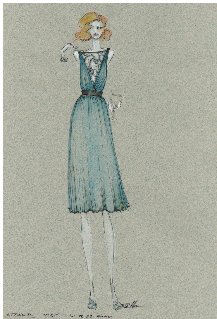
Платье от Эли Сааба для Эвелин, персонажа Николь Кидман в фильме «Порочные игры», было выбрано для фильма костюмерами Бартом Мюллером и Куртом Свенсоном. Набросок Барта Мюллера.