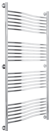
Рис. 1 Модель «Флюид»

1.2. Конструктивно, радиатор изготавливается различных моделей и типоразмеров (рис. 1, 2, 3).