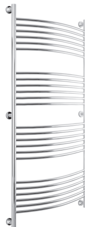
Рис. 3 Модель «Богема» (выгнутая)