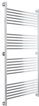
Рис. 2 Модель «Богема» (прямая)