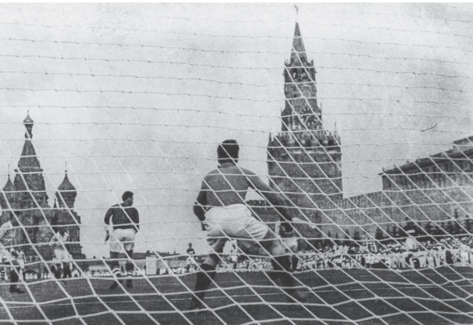
Показательный матч на Красной площади

приятиях и не могли защищать честь прежнего флага по ведомственному принципу, третьи были репрессированы. Пожалуй, главным событием стал визит в освобождённый Сталинград на товарищеский матч 2 мая 1943 года.