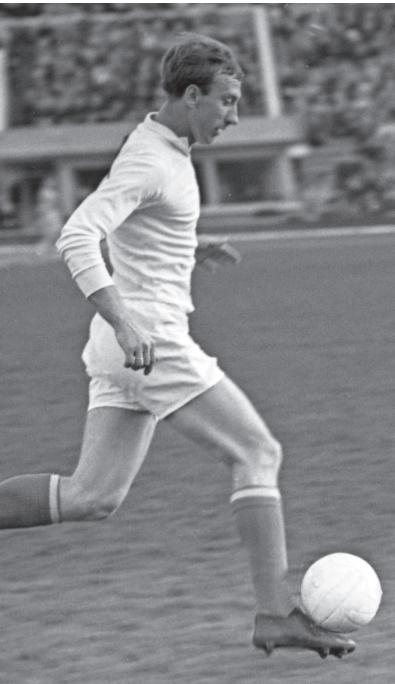
Капитан «Спартак» Игорь Нетто