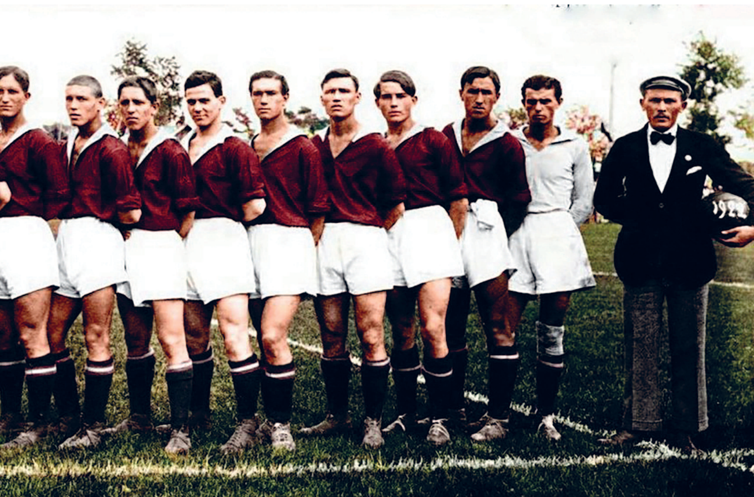
1922 год. Команда «Московский кружок спорта»

Пловдив и Плевен, венгерские Кишкёреш и Ньиредьхаза, словацкая Миява, чешские Рыхнов-над-Кнежной и Сезимово-Усти.