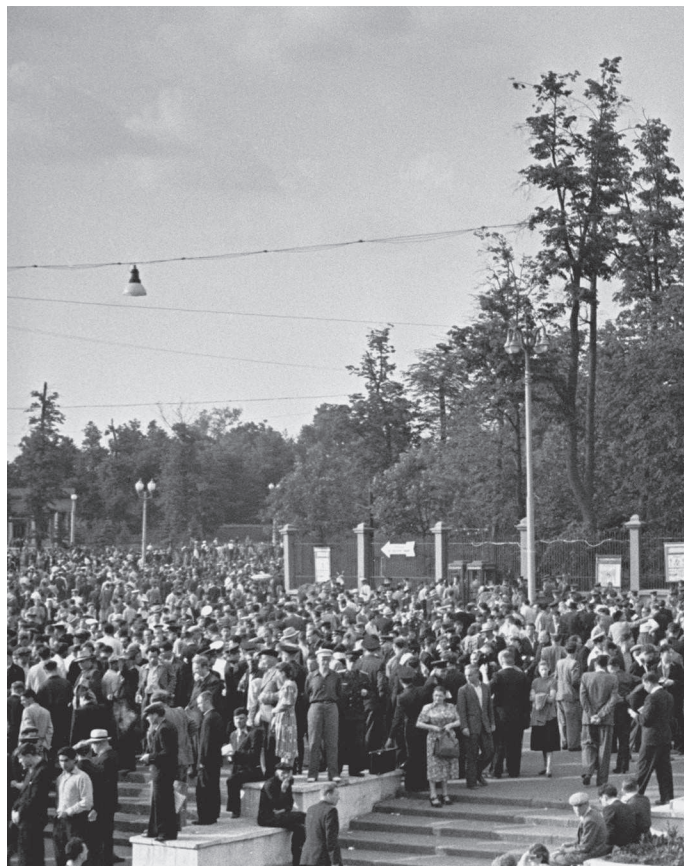
Перед футбольным матчем «Партизан» (Белград) – «Спартак»

чемпионов. Ведь результаты москвичей в товарищеских встречах как на своём, так и на чужом поле свидетельствовали о том, что им по плечу бороться на равных с самыми именитыми соперниками. Важным было и то, что возвратился к работе старший из братьев Старостиных, и вклад Николая Петровича в организацию