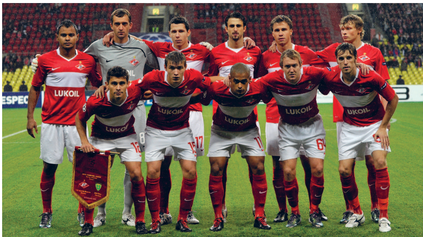
2010 год. «Спартак» перед матчем Лиги чемпионов УЕФА

клубы, адаптировался к реалиям, возникшим после распада Советского Союза. В российском футболе он доминировал вплоть до 2001-го, лишь однажды упустив первое место. Секрет был в том, что в переходный период клуб удачно вложил средства в квалифицированных игроков с постсоветского пространства, а постоянное участие в Лиге чемпионов тоже приносило доходы в кассу. Вдобавок «Спартак» достаточно неплохо