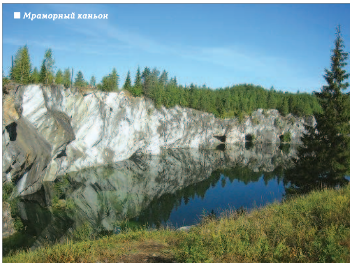
■ Мраморный каньон