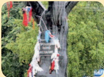
■ Дерево желаний

На Онежской набережной в Петрозаводске раскинуло ветви «Дерево желаний» – подарок шведского города-побратима Умео. Это настоящая сосна, покрытая стеклотканью. На черном стволе прикреплено огромное белое ухо и табличка с надписью «Прошепчи одно желание». Здесь следует задумать желание и потихоньку произнести его в ухо. На ветвях дерева висят колокольчики. Если после того, как желание было загадано, колокольчики начинают звенеть, значит, оно сбывается.