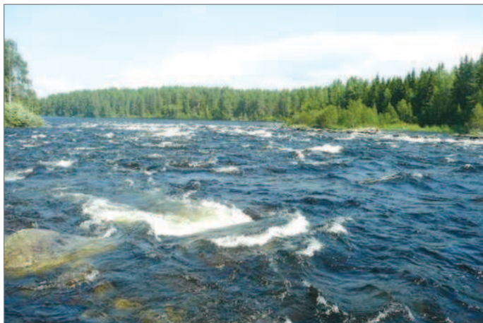
■ Бурная река

ставляет около 640 тыс. жителей, а Швейцарии – 8 млн человек. Почти 40% населения проживает в Петрозаводске. В составе республики – 16 муниципальных районов и 2 городских округа. В Карелии насчитывается более 60 тыс. озер и 27 тыс. рек. Озерно-речная система республики – одна из самых уникальных в мире. Такого соотношения суши и водной поверхности нет больше нигде. В среднем на каждую семью в Карелии, состоящую из трех поколений, приходится одно озеро.