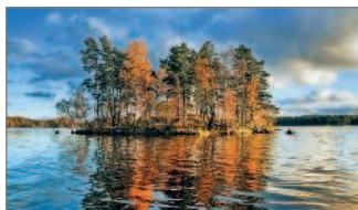
■ Озеро Вуокса