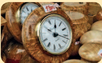
■ Изделия из карельской березы

Это, казалось бы, самое распространенное российское дерево в Карелии обладает уникальными свойствами – золотистым цветом и рисунком, напоминающим мрамор. За твердость и прочность в старину его называли «Царским деревом». Из березы делают вазы, визитницы, зажигалки, блюда, шкатулки, шахматы и авторучки. Владелец такой вещицы может с уверенностью сказать: «Я был в Карелии».