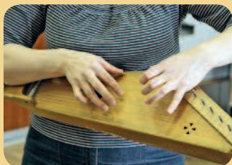
■ Так выглядит кантеле

Посетите «Дом кантеле» в Петрозаводске. Карельский язык сейчас не часто можно услышать на улице, поэтому сюда стоит сходить на концерт ансамбля песни и пляски «Кантеле». Во время выступления вы услышите игру на таких редких инструментах, как кантеле, варган, йоухикко, сигудек, вирсиканнель, талхарпу, пярэ, шаманские бубны, а также песни на северных диалектах русского языка, карельском, вепсском и финском языках. В местном магазине можно купить кантеле – старинный карельский музыкальный инструмент, напоминающий русские гусли.