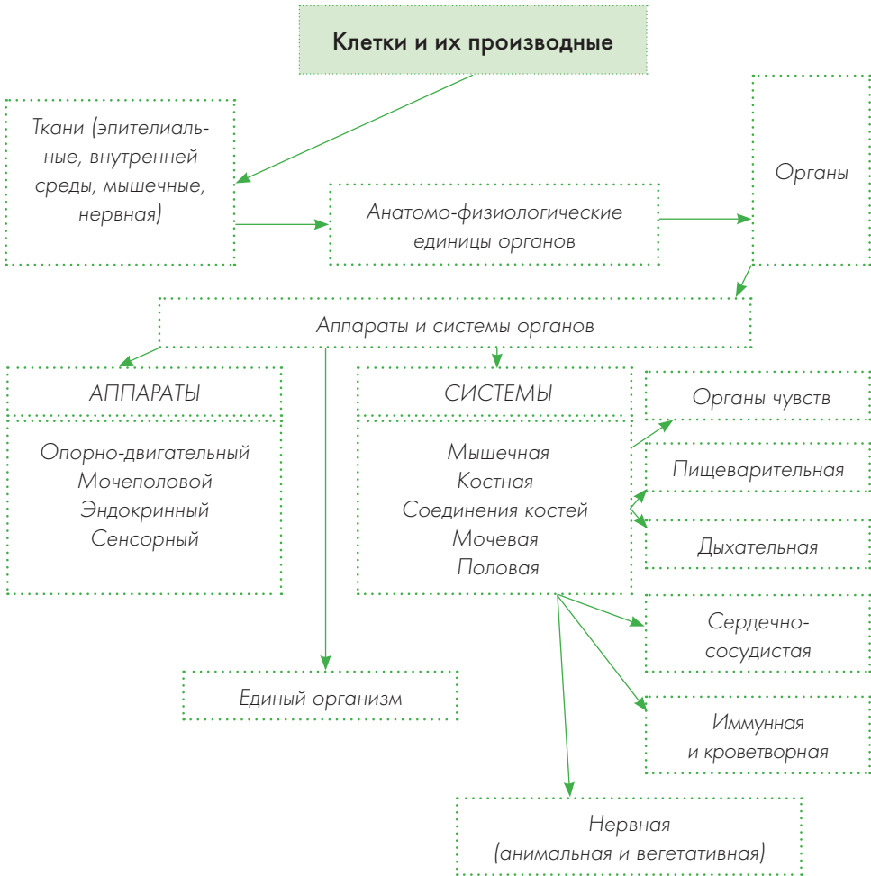
Таблица 1. ИЕРАРХИЧЕСКИЕ УРОВНИ ОРГАНИЗМА ЧЕЛОВЕКА