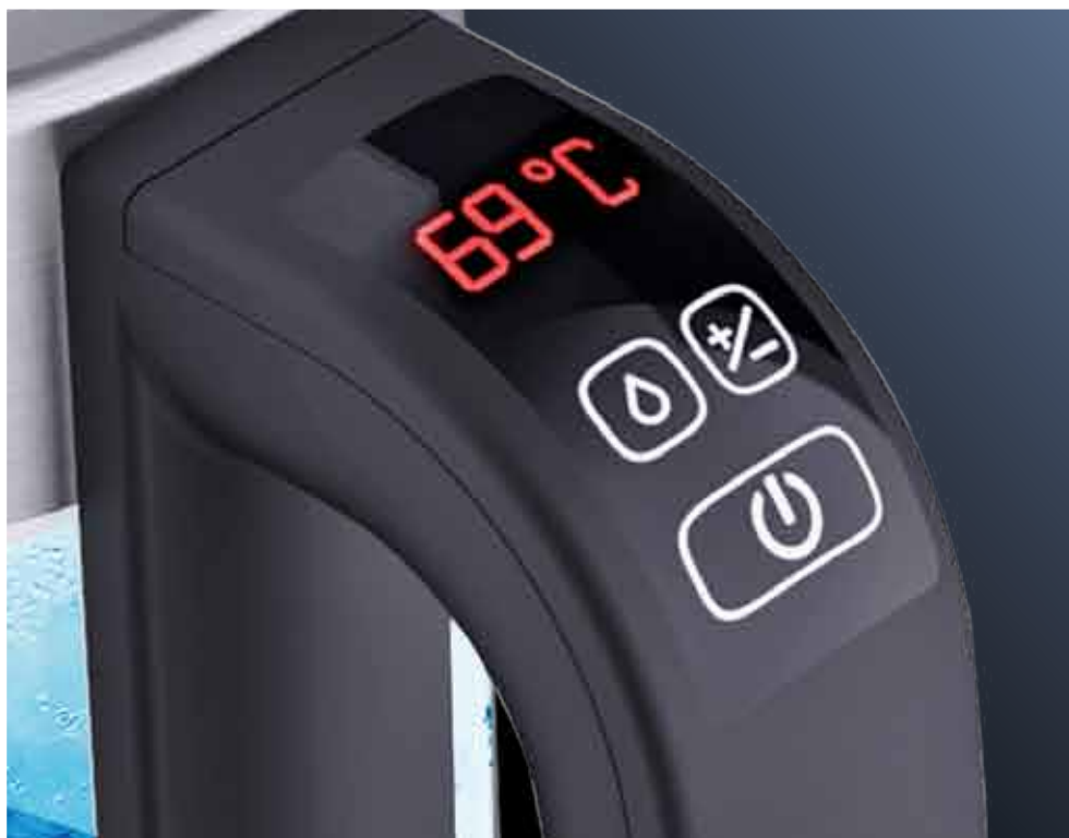
Сенсорное управление/ LED-дисплей