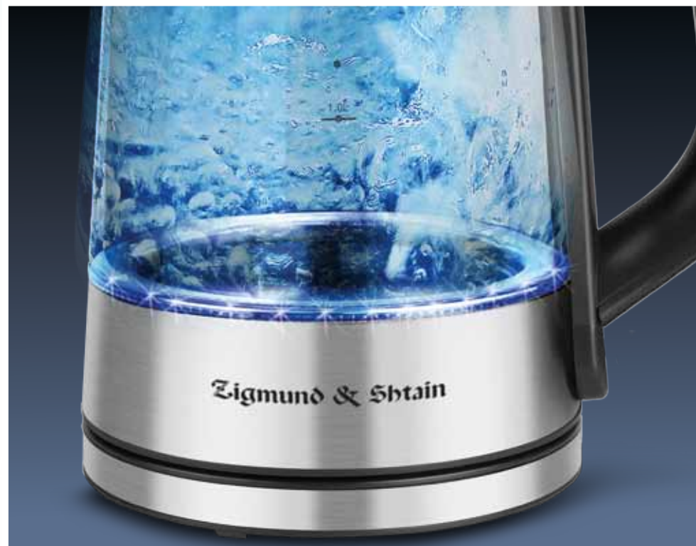
Светодиодная подсветка корпуса