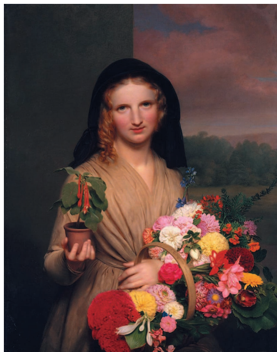
Цветочница. Картина Ч. Ингхэма. 1846. Музей Метрополитен, Нью-Йорк

Флористика как отдельная профессия появилась довольно поздно. Да и названия для нее долгое время не было. Людей, которые работали с цветами и растениями, называли по-разному. И обязанности у них могли быть различные. Например, придворный церемониймейстер мог «в нагрузку» к своей основной работе заведовать цветочным украшением дворца, а цветы для этого выращивал придворный садовник. Или, скажем, какой-нибудь купец открывал лавку, в которой торговал цветами и другими растениями, а за отдельную плату для знатных клиентов создавал из них гирлянды, венки, разнообразные композиции... Флористику и цветочный дизайн никак не отделяли от цветоводства, садоводства и торговли цветами. Знания и умения передавали от отца