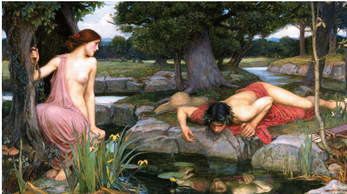
Нарцисс и нимфа Эхо. Картина Дж. Уотерхауса. 1903. Художественная галерея Уокера, Ливерпуль