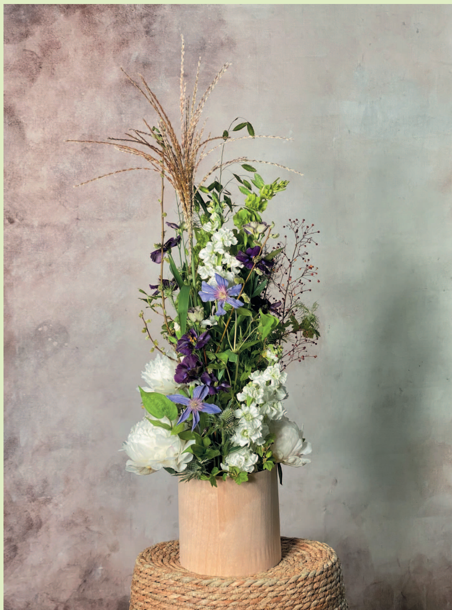
Пример компактной композиции с использованием флористической пены в основе