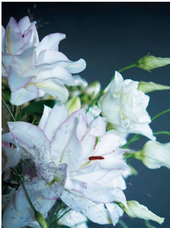
Современная «махровая» лилия. Как видите, тычинок у нее очень мало!

В мои обязанности входило... убирать из цветов тычинки. Дело в том, что пыльца, которая из них высыпается, пачкает одежду, скатерти и лепестки самого цветка, оставляя некрасивые ржавые пятна. И когда я приходил из школы, мама вручала мне пинцет, я шел в подвал и аккуратно выщипывал из раскрывающихся бутонов тычинки. А у лилий их много! Представьте, четыреста лилий и на каждой — шесть-семь бутонов... Даже если учесть, что открываются они не все сразу, времени на обработку одной партии уходило много. Из подвала я выходил примерно с килограммом собранных тычинок! А через несколько дней приходила очередная партия цветов, и все начиналось заново. Видимо, поэтому у меня сохранилось предвзятое отношение к лилиям — я «объелся» ими в детстве. И много лет практически не работал с этими цветами, используя их только в случае крайней необходимости. Но сейчас появились лилии генно-модифицированные — у них очень мало тычинок. Такие цветы